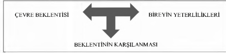
Şekil 3: Çevre beklentisi, bireyin yeterlilikleri ve beklentinin karşılanması ilişkisi

2.5. Özürlülük: Bedensel, zihinsel ve ruhsal özelliklerinden belirli bir oranda ve sürekli olarak fonksiyon ve görüntü kaybına neden olan organ yokluğu veya bozukluğu sonucu kişinin normal yaşam gereklerine uyamama durumudur. Bu durumdaki kişiye özürlü denilmektedir” (Mutluer, 1997, s:10).