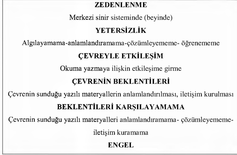
Şekil 1: Zedelenme-Yetersizlik- Engel İlişkisi

getiremeyecektir. Konuşma bozuklu yaşıyan bir çocuk bayramda çıkıp şiir okuyamayacaktır.