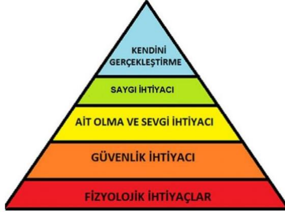
Şekil 3: Maslow'un Gelişme Gereksinimleri (İhtiyaçlar Hiyerarşisi)

Hümanist psikologlardan Maslow; beslenme, nesli sürdürme gibi fizyolojik gereksinimlerin insan için temel teşkil ettiğini bunun yanında güven duyma, ait olma gibi ihtiyaçların da son derece önemli olduğunu söylemektedir. Maslow'un tümüne, "Gelişme Gereksinimleri" dediği bu yüksek seviyedeki ihtiyaçlar, temel güdüler doyurulduktan sonra ortaya çıkmaktadır.