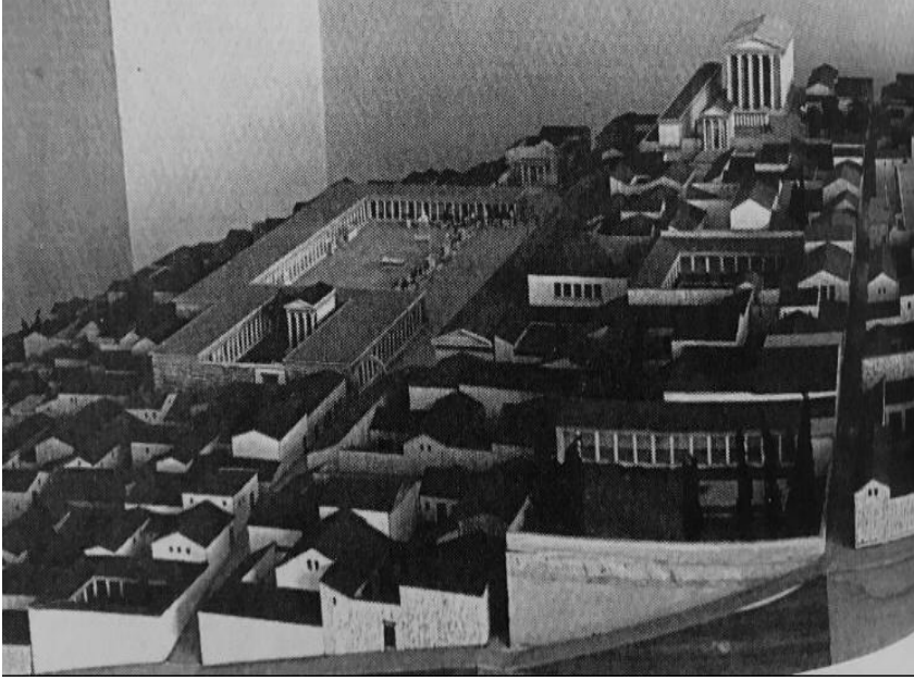
Güneydoğudan şehrin merkezi (Wycherley, 2011)

Schrader'in gerçekleştirdiği arkeolojik kazılar sonucunda "gıda pazarı" olarak isimlendirilen bir alan bulunmuştur. (aktaran Mert, Priene'deki gıda pazarı, 2016) Bu pazarda kentin konumunda dolayı gelişen balıkçılığın etkisiyle deniz mahsulleri ön plana çıkmaktadır. (Mert, Priene'deki gıda pazarı, 2016) Priene'nin konumlandığı coğrafyanın iklim yapısı ekonomi gibi mimariyi ve halkın yaşamını da etkilemiştir; evlerin yapımında güneşten faydalanabilme durumu göz önüne alınmıştır. (Bozkurt, 2002) Priene Antik kentinin tiyatrosu ise günümüze en iyi şekilde ulaşmış antik tiyatrolardan biridir. (Al-Sabbagh & Gorgees, 2019) Prienelilerin suyun kullanımı için tasarladıkları altyapıların çok gelişmiş olduğu söylenmektedir. (Bozkurt, 2002) Priene Stadyumu'nda düzenlenen yarışmalar kentin antik dönemde gezginler için önemli bir uğrak noktası olmasını sağlamıştır. (Seyhan, 2010)