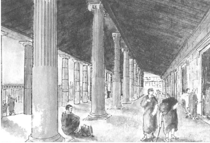
Priene Kutsal Stoa (Wycherley, 2011)

İnsanlar zamanla doğal mekan olarak adlandırılan, doğada yaşama pratiklerini içeren alanlardan uzaklaşarak çeşitli malzemeler ile oluşturdukları, sınırları bulunan mimari mekan olarak tanımladığımız alanlarda yaşamaya başlamıştır. (Can, 2003) Doğanın insan yaşamına etkileri mimari alanı etkilemiştir. İnsan, bulunduğu mekanları kendi gereksinimleri doğrultusunda değiştirmekte ve kendine uygun hale getirmektedir. (Can, 2003) Kentlerin yalçın noktalarında yağmur sularının rahatça akabilmesi için taş döşenmesi gerekmiştir. (Wycherley, 2011) Bir diğer yandan hava şartlarına göre mekanlar tasarlanmıştır. Örneğin Yunan kentlerinde stoa isimli mimari yapılar inşa edilmiştir. Bir tarafında sütunlar arka tarafında duvar bulunan bu çatıya sahip mekan (Gates, 2015) sıcak havalarda insanların güneşten kaçınmalarını ve kötü hava şartlarında sığınmalarını sağlamıştır. (Wycherley, 2011)