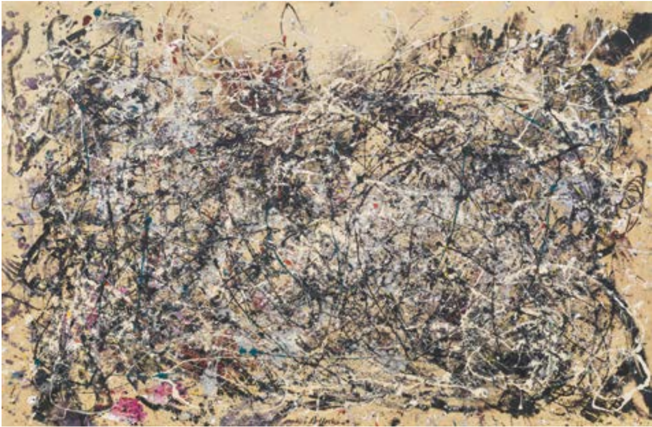
▲ Jackson Pollock, Number 1 , 1948