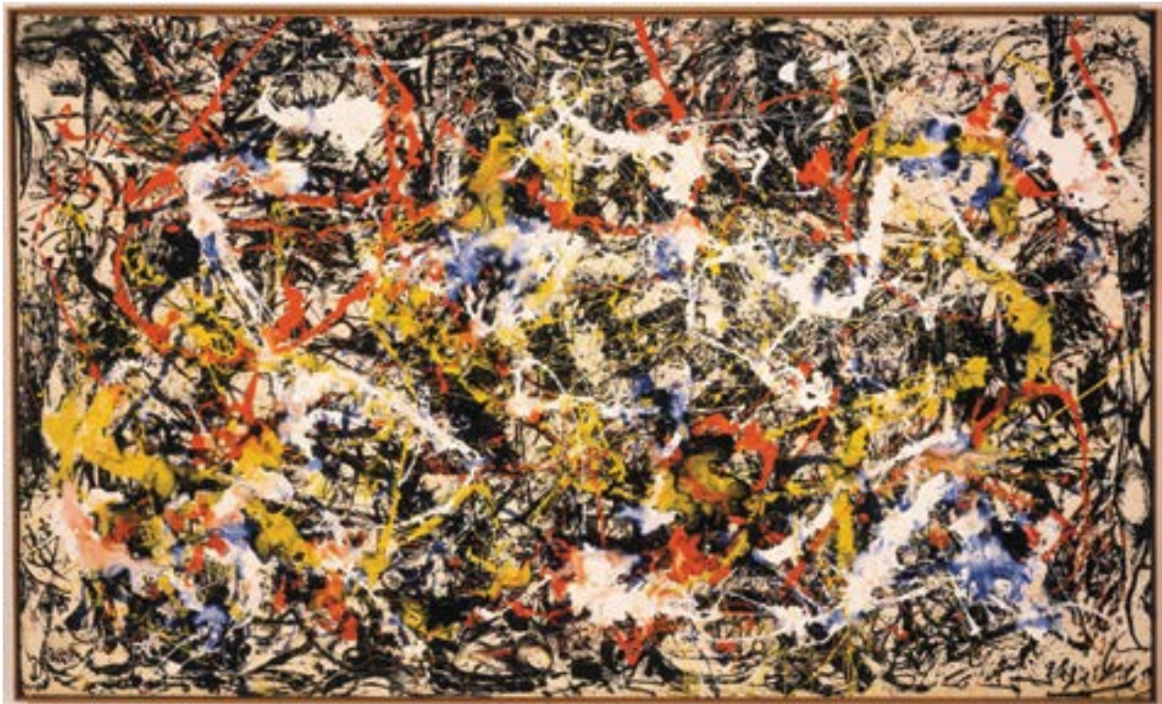
▲ Jackson Pollock, Convergence , 1952