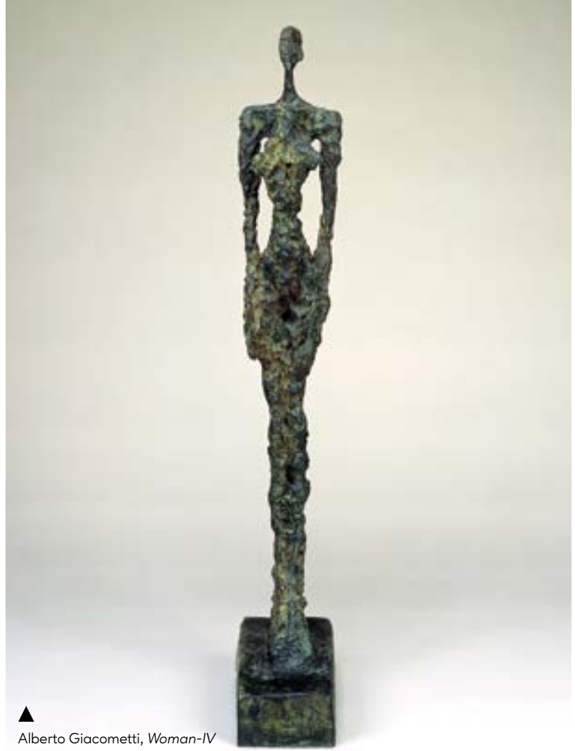
▲ Alberto Giacometti, Woman-IV

1930 doğumlu ressam Jasper Johns 1950’lerde, de Kooning’in aksine, eril gözün yerini biseksüel bir yaklaşımla doldurmaya çalışan bir çıkış yapmıştı. Rauschenberg’le yakın ilişki içindeki sanatçı, bir yandan da Duchamp’ın provokatif işlerinin takipçisiydi. 1950’lerin ikinci yarısında kırılmaya başlayan toplumsal cinsiyet