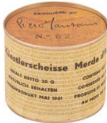
◀ Piero Manzoni, Sanatçının Boku

tirdi. Francis Bacon, (Sigmund Freud'un torunu olan) Lucian Freud ve başkaları Londra'daki sanat çevrelerinde uzun süredir Paris ve Berlin'e kıyasla çok geride kalmış durumdaki resim sanatını hareketlendirirken, Fransa'da Yves Klein gibi simalar varoluşçu felsefenin rüzgârında gemisini yürütenin ticari –hatta şarlatanca– yollarını bulmaktaydı. 1960'ta başladığı kabul edilen yeni-realizmin öncüsü, performans sanatının erken yaşta ölen yakışıklı yüzü Klein'in (1928-1962) sanat skandalları ve birtakım sahtekârlıkları bu dönemi anlamak adına araştırmaya değer niteliktedir. Onun açtığı yolda Fransız sanatı, savaş sonrası dönemde hızla yükselen refahtan pay almak isteyen genç ve hırslı sanatçıların giderek daha tuhaf ( queer ) eserler ve performanslar vermesini cesaretlendirdi. İtalya'da da genç bir sanatçı olan Piero Manzoni (1933-1963), tıpkı Klein gibi, yaşamakta olan tüketim çağında her şeyin sanat eserine dönüştürülebilirliği tezini provokatif bir hamley-