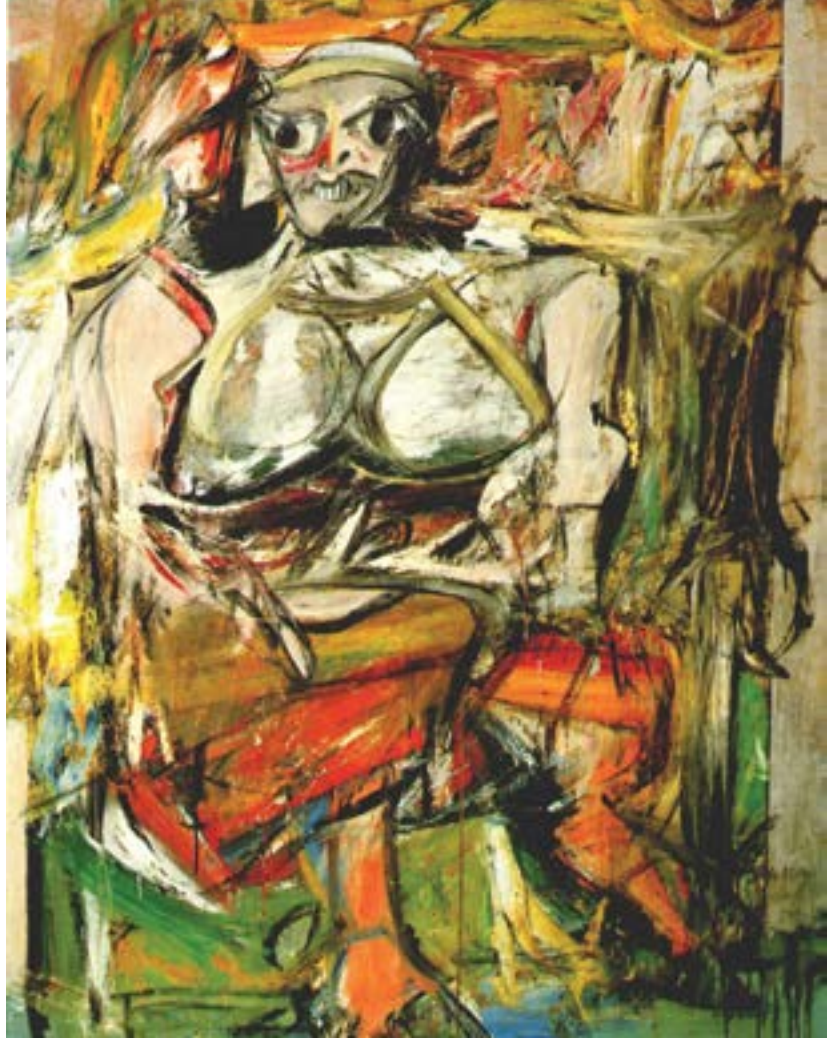
▲ Willem de Kooning, Woman-I

Avrupa'daki faşizmden kaçan -Einstein'dan Arendt'e, Panofsky'den Adorno'ya- bilim insanlarının ve entelektüellerin yanı sıra Max Ernst, André Breton, Yves Tanguy, Marc Chagall, Marcel Duchamp gibi göçmen modernist sanatçıların büyüyen varlığı New York'a "yirminci yüzyılın sanat başkenti" olma iddiasını destekleyecek bir hava getirmekteydi. MoMA ve Guggenheim Müzesiyle birlikte başka yerlerdeki sergilerde de sık sık Picasso, Miro, Kandinsky, Chirico, Cézanne gibi isimlerin eserleri New York'ta sergileniyordu. Elbette geçici olarak gelen eserler ve yeni gelen göçmen sanatçılar, onlardan etkilenen ABD'li sanatçıların da bu sahnede yerlerini almasının önünü açmaktaydı. Yani ABD, Avrupa'ya askeri ve politik-ekonomik