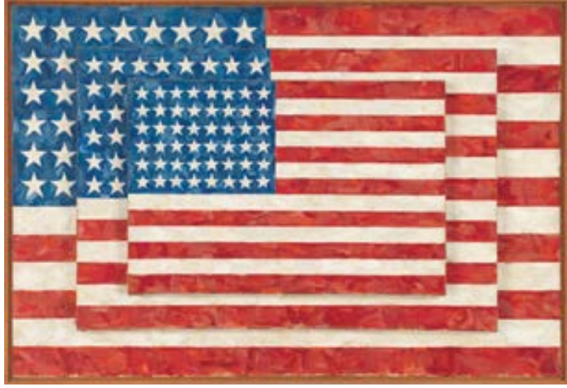
▲ Jasper Johns, Bayrak , 1954-55

yakından ilgilendi ve varıl aile kültürünün getirilerini 1940'ların ortalarından itibaren sanatına taşıdı. Eleji (ağıt) türünden ilhamla başladığı ve 60'ların sonlarına dek sürdürdüğü ölüm karası tonlamalarla dolu soyut dışavurumcu tabloları onu (biraz da elit zümreye mensup olmasının katkısıyla) en prestijli yerlerde sergi açan ünlü bir ressamla dönüştürmeden evvel, Motherwell tutkulu bir artistik arabulucuydu. New York'taki meteliksiz sanatçıları destekleyip etkili sanat tarihçisi Meyer Schapiro, eleştirmen Clement Greenberg ve sanat taciri Peggy Guggenheim ile buluşturan, Amerikan resmine Latin Amerika'daki gelişmeleri ya da Uzak Asya motiflerini kazandırmaya çalışan biri olarak esaslı katkıları söz konusuydu. Motherwell, Şilili ressam Roberto Matta (1911-2002) ile İkinci Dünya Savaşı sırasında gerçekleştirdikleri bir Meksika seyahatinden sonra Avro-Amerikan resminde mevcudu aşma zorunluluğunu görmüştü. Bu taklitle değil, sınırları yırtıp geçmekle mümkündü. O dönem için hissettiklerini, etrafta "şiddet dâhil, yaratıcı bir ilke"nin olmamasıyla ilişkilendiriyordu. Bu yüzden ABD'de modern sanatı seven herkes onu kopyalıyordu. Gorky, Pollock, de Kooning; hepsi Picasso'yu kopyalıyordu... İhtiyaç duyulan tek şey yaratıcı bir ilkeydi. Motherwell, 50'leri hazırlamak adına hem North Carolina'ya gidip deneysel bir sanat eğitimi merkezi olan Black Mountain College'ta