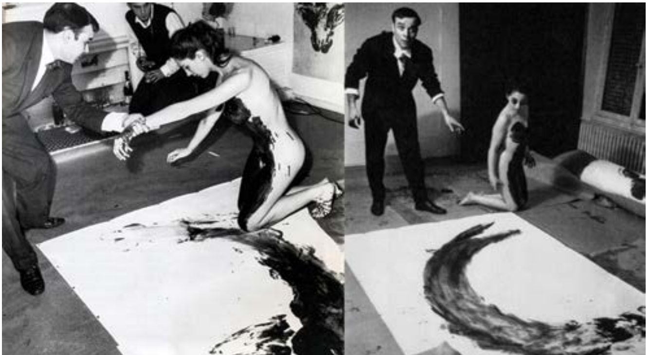
▲ Yves Klein, Barbara