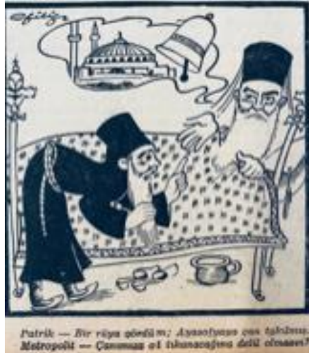
Resim 3. 10: Ayasofya'ya Dair Karikatür

Fethin 500. yılı yaklaşırken Büyük Doğu gazetesinde de konuya ilişkin haberler görülmeye başlamıştır. 2 Ağustos 1952 gününe ait gazetede “500’üncü Fetih Yılı” 155 başlığı altında gerçekleştirilecek törene Mehter takımı ve Yeniçeri ortasının da eşlik edeceği haberi verilmiştir. Haberin devamında ise bir heyet tarafından müze, kütüphane ve arşivlerin incelenmesi sonucunda döneme dair elbise, zırh, miğfer, kalkan, musiki aletleri gibi gereçlerden oluşan bir müfreze hazırladığı da yapıldığı belirtilmiştir.