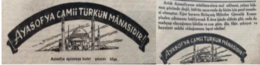
Resim 3. 13: “Ayasofya açılıncaya kadar çıkacak klişe”

Kıbrıs meselesinin ülke gündemini sardığı bu yılda Büyük Doğu dergilerinde Ayasofya konusunun daha sık işlendiği ve klişelerle konunun desteklendiği görülmüştür. Ayrıca 1966’da Kıbrıs davasına dikkat çekilerek, Batının bu konuda Türkiye’ye karşı tutumu eleştirilmiştir. Bu konuda “Onların ikiyüzlü tutumuna karşın” biz “kendisinden” olmak uğruna “uygarlaştığımızı, özgürleştığımızı, batılılaştığımızı” iddia etmekteyiz denilerek durumun ironikliği vurgulanmıştır. 179