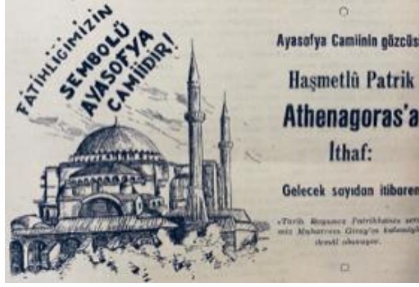
Resim 3. 11: “Fatihliğimizin sembolü Ayasofya Camiidir!”

Fethin 503. yılı olan 1956 yılında gazete olarak çıkan Büyük Doğu’da “Fethin 503’üncü yıldönümü bu sene çok sönük kutlanıyor” 164 haberine yer verilmiştir. Haberde yıldönümü için program düzenleyen Fatih Derneği’nin planladığı programın verilmesinden sonra bu merasimin çok basit ve sönük geçeceği ifade edilmiştir. Bunun nedeni olarak belediye, il ve maarif vekâletinin yıldönümüne yönelik kutlamalardan kaçınarak Fatih Derneği’ni yalnız bırakması gösterilmiştir. Bu törenlerin “Et Narhı ve Bahar Bayramı”ndan önde olduğu ifade edilirken “Bu bir tarih borcudur” denilerek kutlamaların önemi vurgulanmıştır.