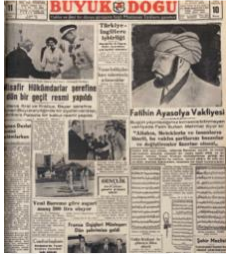
Resim 3. 7: “Fatih’in Ayasofya Vakfiyesi”

edilmiştir. Yazı son olarak “bizimle beraber düşmana en yakın burçlarından biri olarak gördüğümüz Yunan devlet reisini selâmlarız.” ifadeleriyle sona ermiştir.