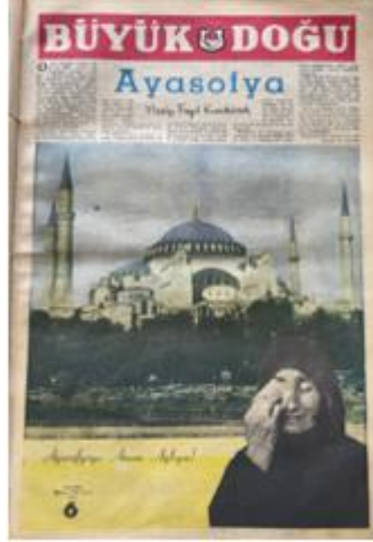
Resim 3. 12: “Ayasofya’ya Anam Ağlıyor” yazısını içeren Ayasofya Yazısı

1965 yılından itibaren Büyük Doğu dergilerinde çizgisel bir Ayasofya resmi ile “Ayasofya Camii Türkün mânasıdır!” yazılı olan klişeler görülmeye başlamıştır. Bu klişe ilk olarak, yukarıdaki tarihsel sıralamada görüleceği üzere, 1952 yılında, ardından 1954’de Büyük Doğu gazetesinde karşımıza çıkmaktadır. 1965 yılındaki ilk klişe ise 8 Aralık 1965 tarihinde “Ayasofya açılıncaya kadar çıkacak klişe” 174 notuyla yayınlanmıştır. Bu paylaşımın ardından kimi zaman bazı notlarla, kimi zaman yalnız klişe olarak yayınlanmaya devam etmiştir. 175 Klişe ile birlikte paylaşılan notlar; “Son Nefesimize Kadar Çılgılığımız” 176 ve “Hayat hakkımızın