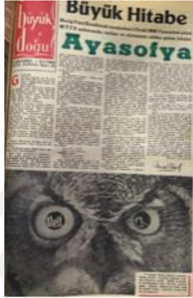
Resim 3. 18: Ayasofya Büyük Hitabesi

tutulmaktadır. 29 Aralık 1965'te Milli Türk Talebe Birliđi (MTTB) tarafından düzenlenen etkinlikteki konuřması, Hitabeler isimli kitabında da tam metin olarak okurlarına sunulmuřtur. Ayrıca 9 Ocak 1966 tarihli Büyük Dođu dergisinde de kapak olarak verilerek dikkatler bu konuya çekilmeye çalıřılmıřtır. 186