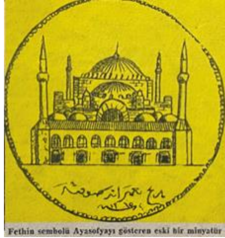
Resim 3. 6: Ayasofya Resminin Bulunduğu Minyatür