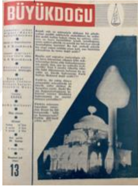
Resim 3. 4: 6 Ocak 1950 tarihli Büyük Doğu Kapak Sayfası

bulunmaktadır. Yazının içeriğinde ise Ayasofya'ya kendi manaları dışında takılan ışıkların onu yalnızca plastik ve estetik bir yapıya sıkıştırdığı, manasından uzaklaştırdığı ve bu halin onu yıkmaktan daha kötü olduğu ifadeleri yer almaktadır. Ülkemizin bulunduğu coğrafyanın anahtar rollerinden birinin Ayasofya sayesinde olduğu ama iki karşıt medeniyet savaşında bir zafer abidesi olan Ayasofya'nın müzeye çevrildiği belirtilmektedir. Türk'ün manasının yok sayıldığı bu eylemden sonra hâlâ “Fethin 500'üncü yılı”nın mı konuşulduğu sorulmaktadır. 127