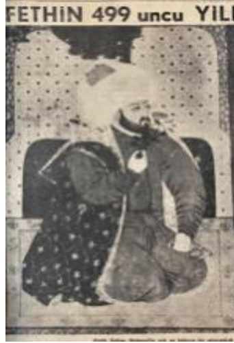
Resim 3. 5: Fatih Sultan Mehmed'in Resmedildiği Minyatür