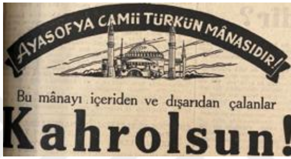
Resim 3. 9: “Kahrolsun”

Ayasofya'yı camiye dönüştürmesi, Akşemseddin'in ilk Cuma namazını kıldırışı ve bir rivayete göre hutbenin Sultan tarafından okunduğu ifadelerine yer verilmiştir. Böylece mabedin camiye dönüştürülmesinin ve Fetih Camii olarak anılmasının manası okurlara hatırlatılmaya çalışılmıştır. Bu mananın yalnız Türk milletini değil, tüm İslam dinini kapsayacak kadar büyük olduğu ve Türk milletinin en zor dönemlerinde dahi Ayasofya'nın cami statüsünden çıkarılmasının konu edilmediği ifade edilmiştir. Mütareke döneminde dahi akla gelmeyen bu konuyu o dönem düşünenlerin olduğu özellikle vurgulanmıştır.