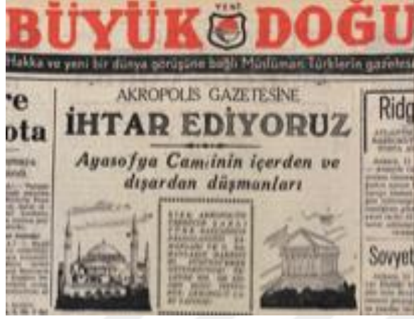
Resim 3. 8: “Akropolis Gazetesine ihtar ediyoruz.”

haberde “iğrenç hadiselerin” sorumlularının Yunan hükümeti tarafından cezalandırılması talebi vurgulanmıştır. 147