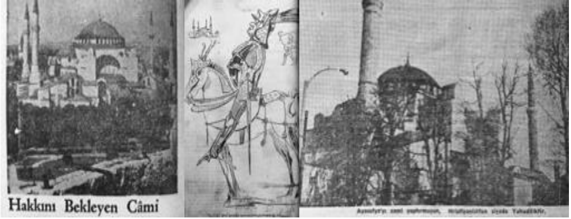
Resim 3. 15: “Hakkını Bekleyen Cami”