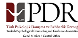
Türk PDR Derneği