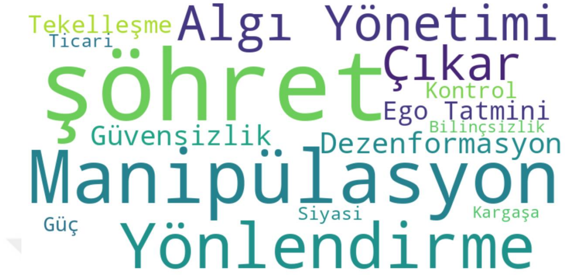
Şekil 4.4: Agnotolojik Bilginin Arkasındaki Temel Amaçlar

agnostolojinin amaçlarına yönelik katılımcı yanıtlarında sık geçen anahtar kelimelerin kelime bulutunu sunmaktadır.