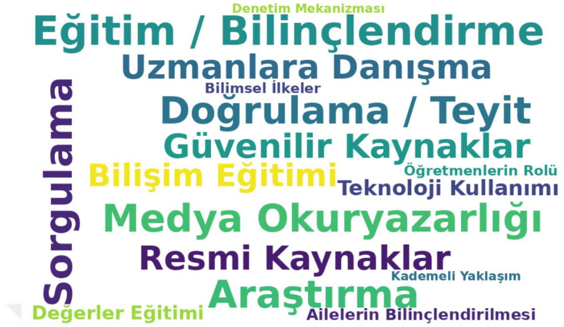
Şekil 4.6: Agnotoloji ile Mücadele Stratejileri

“Agnotoloji ile Mücadele Stratejileri” temasına ilişkin oluşturulan kelime bulutu, katılımcıların bilgi kirliliğiyle mücadelede en etkili yöntem olarak eğitimi ve bilinçlendirmeyi ön plana çıkardıklarını göstermektedir. Özellikle “Eğitim / Bilinçlendirme”, “Medya Okuryazarlığı”, “Sorgulama”, “Araştırma” ve “Doğrulama / Teyit” gibi kavramların öne çıkması, yanlış bilgiyle başa çıkmak için bireysel yetkinliklerin geliştirilmesi gerektiğine işaret etmektedir. Katılımcılar, bireylerin pasif bilgi alıcıları olmaktan çıkarak aktif bilgi sorgulayıcıları hâline gelmeleri gerektiğini vurgulamışlardır. “Güvenilir Kaynaklar”, “Uzmanlara Danışma” ve “Resmi Kaynaklar” kavramları, bilgi ediniminde rehber alınması gereken yapılar olarak görülmektedir. Ayrıca “Bilişim Eğitimi”, “Teknoloji Kullanımı” ve “Değerler Eğitimi” gibi kavramlar, çocuk ve gençlere yönelik önleyici stratejilerin önemini göstermektedir. “Ailelerin Bilinçlendirilmesi” ve “Öğretmenlerin Rolü” gibi düşük yoğunluklu ama anlamlı kavramlar ise, sürece tüm paydaşların dâhil edilmesi gerektiğini ortaya koymaktadır. Bu bulgular, agnotolojiyle etkili mücadelenin ancak çok katmanlı, eğitim temelli ve bütüncül yaklaşımlarla mümkün olabileceğini göstermektedir.