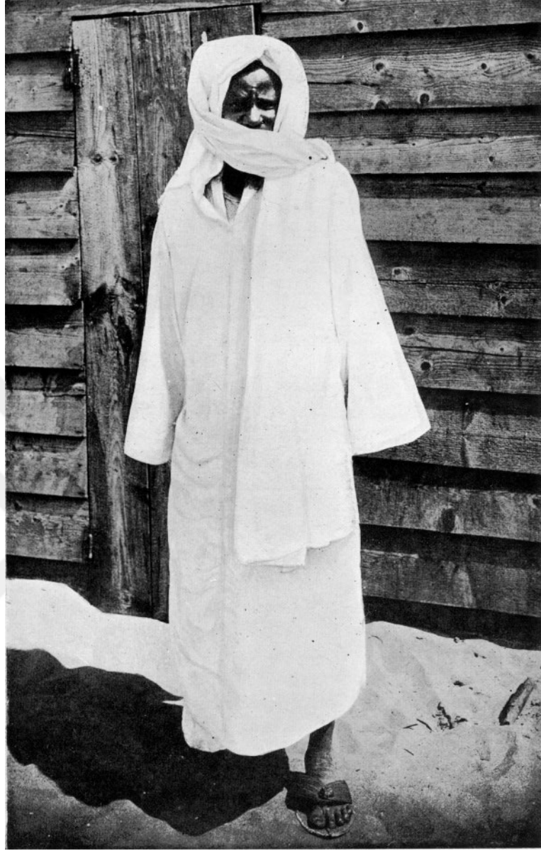
Şekil 3.1: Şeyh Ahmedu Bamba