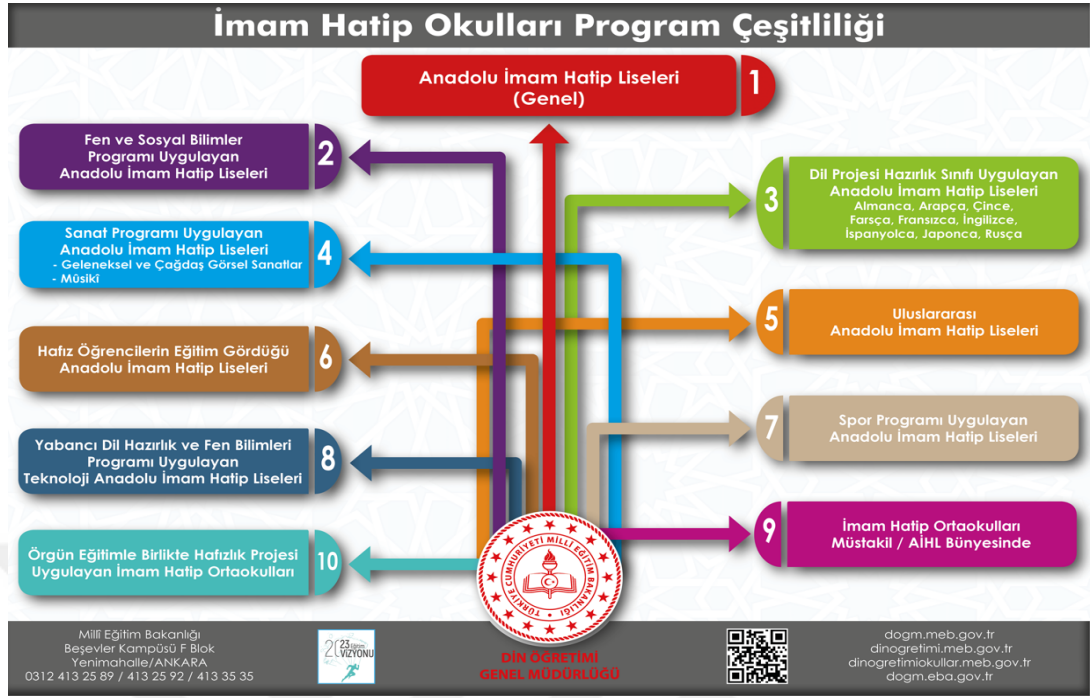
Tablo 2.1: İmam Hatip Lisesi Program Çeşitliliği

Kaynak: Din Öğretimi Portalı, t.y / https://dinogretimi.meb.gov.tr [01 Aralık 2022]