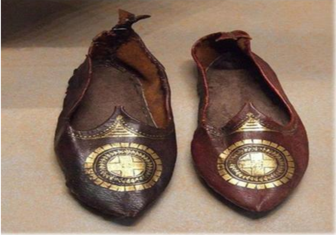
Ucu sivriltilmiş deriden yapılmış ayakkabı, 5. – 8. yüzyıl, British Museum