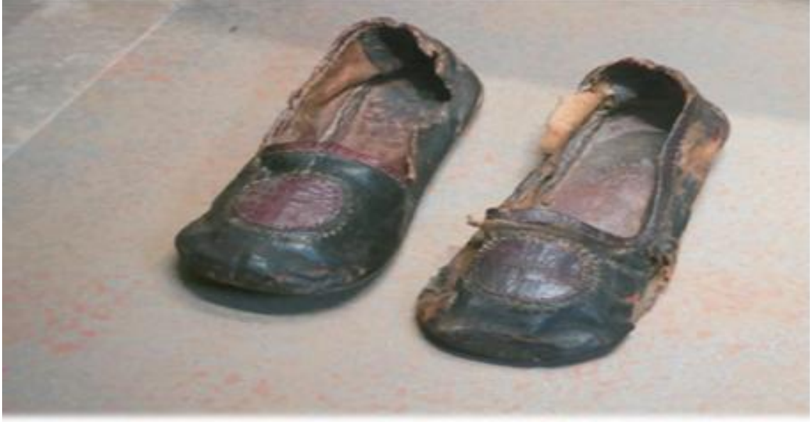
Deriden yapılmış çocuk ayakkabısı, 5. - 8. yüzyıl, British Museum