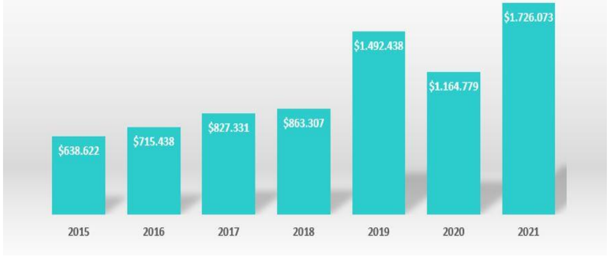
Şekil 3.1: Yıllar İçerisinde Türkiye’deki Sağlık Turizmi Gelirleri