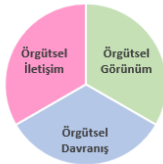
Şekil 2.1. Örgütsel İmajın Boyutları (Peltekoğlu, 2009).