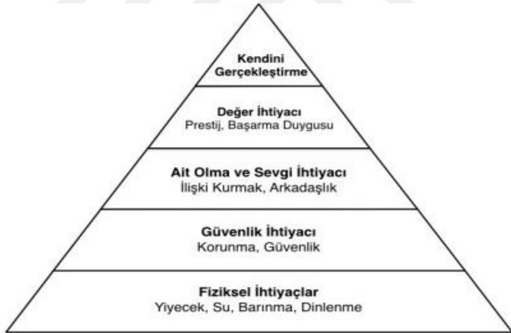
Şekil 2.1: Maslow' un İhtiyaçlar Piramidi

Kişilerin sosyal çevrelerindeki kişilerce tanınması, bilinmesi, kabul edilmesi ve kendisini değerli hissetmesi ihtiyacı aidiyet olarak adlandırılmaktadır. Aidiyet aile, arkadaşlara, okula, mekanlara, dinlere, mesleğe, sosyal gruplara ya da etnik kökene karşı kurulabilmektedir. Maslow' un ihtiyaçlar hiyerarşisine göre aidiyet bireylerin fiziksel ve güvenlik ihtiyaçlarından sonra gelmektedir ve aidiyetin karşılandığı ilk yer ailedir (Maslow, 2000).