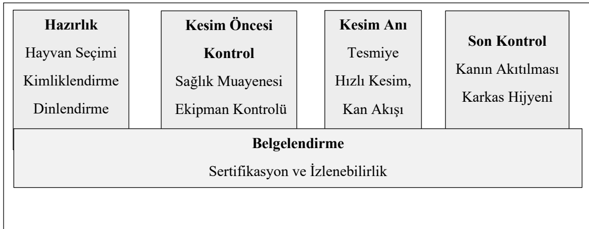
Şekil 1. Helal Kesim Süreci (Akış Şeması).

Helal sertifikasyonun: (i) helal standardına uygunluğu bağımsız otoritelerce doğrulamak, (ii) tüketici güvenini artırmak ve (iii) uluslararası pazara erişimi kolaylaştırmak üzere üç temel hedefi bulunmaktadır. Günümüzde helal belgelendirme; yalnızca ürün değil, süreç ve altyapının tamamını kapsayan bir yönetim sistemi niteliğinde ele alınmaktadır (TSE OIC/SMIIC 1:2019). Bu bağlamda helal et üretiminin temel bileşenlerini oluşturan başlıca kontrol ve değerlendirme alanları Çizelge 1’de özetlenmiştir.