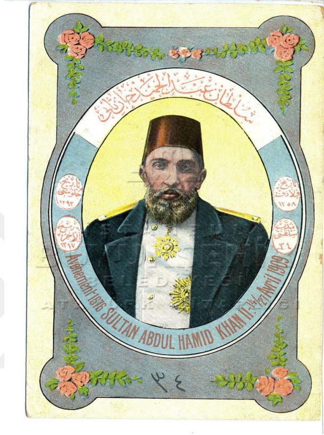
Ek. 1 Sultan II. Abdülhamit'in Portresi