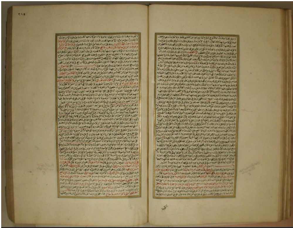
اللوحة الأولى من القسم المحقق، نسخة (مكتبة الآثار المخطوطة بالمنطقة، قونية: 4043)