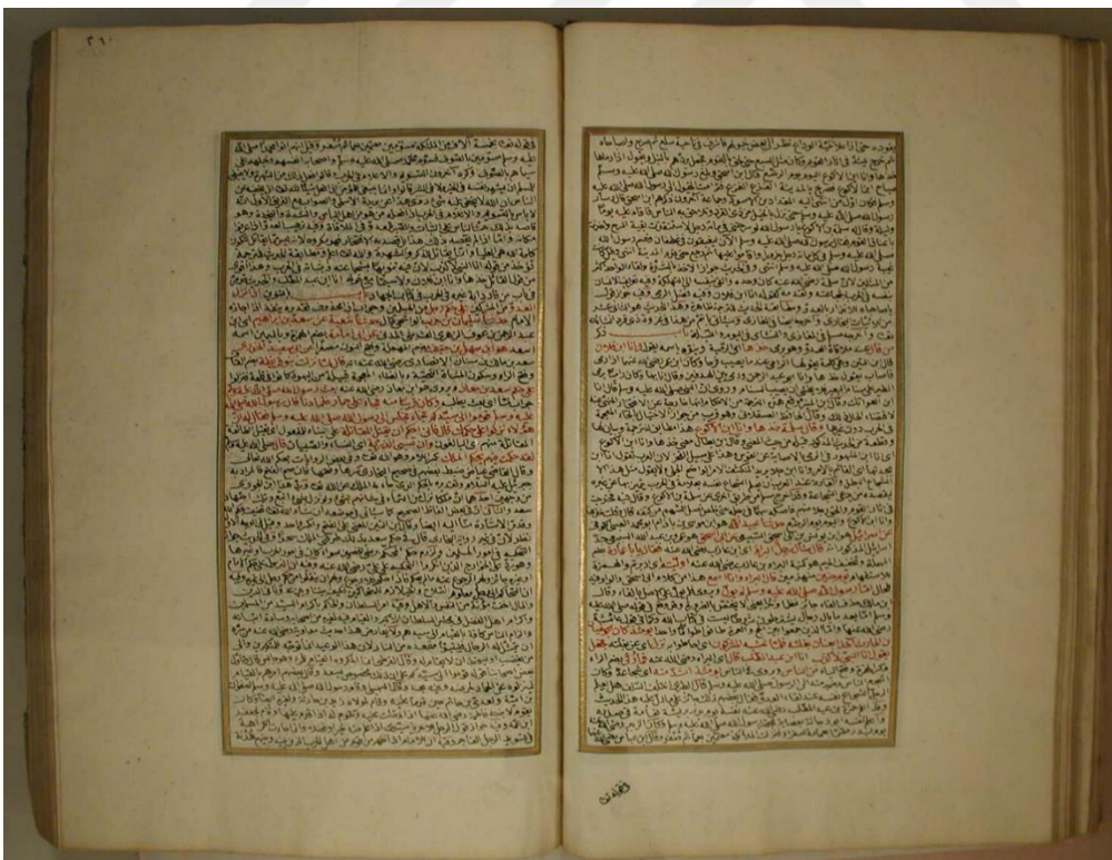
اللوحة الأخيرة من القسم المحقق، نسخة (مكتبة الآثار المخطوطة بالمنطقة، قونية: 4043)