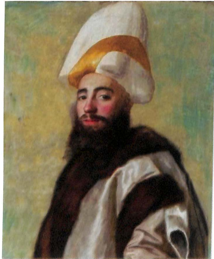
Ressam Liotard'ın Sadrazam portresi, 1738-43

"Tarihçibaşı-zade" adıyla tanınan Şeyh Muhammed Âgâh Ağa (ö.1770), devrin meşhur mesnevîhanlarından biridir. Âgâh Ağa, Galata Mevlevîhanesi'nin az ilerisindeki bir konakta oturarak burayı bir mahfile dönüştürmüştür. Türk