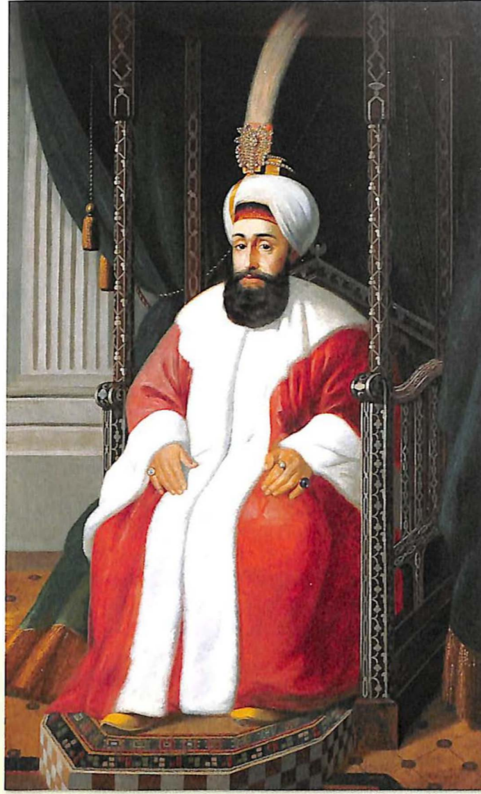
Joseph Warnia-Zarzecki'nin fırçasından Sultan III. Selim

himaye ve iltifatı da giderek artmıştır. Çok sevdiği şair dostu sultana methiyeler sundukça sultan da her fırsatta onu manevî değeri büyük caizelerle lütuflandırmıştır. Bir edebî sohbet meclisinde şair dostuna Cevrî'nin ta'lik hattıyla yazılan ve sayıca az bulunan bir Mesnevî-yi Şerîf hediye etmiş ve Gâlib de bu hediye karşılığında: