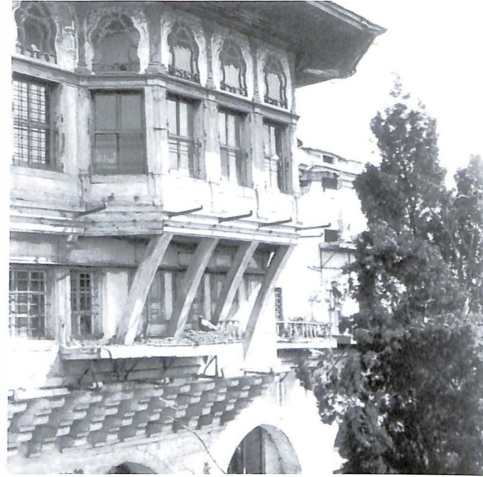
Topkapı Sarayı'ndaki bir köşkün dış görünümü, Abdullah Biraderler, 19. yüzyıl sonu