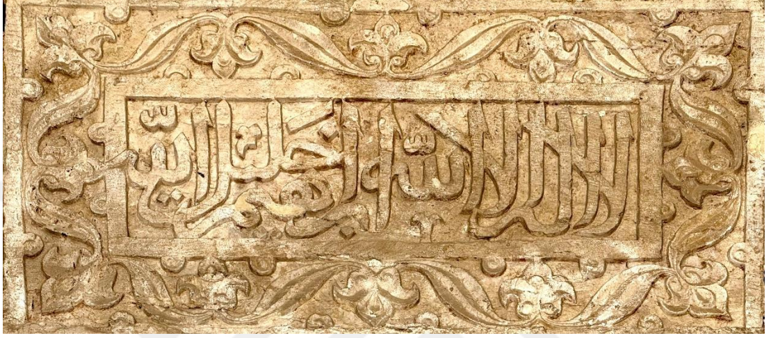
Resim 4.2: El Halil Kapısının girişine nakşedilen Kelime-i Tevhid

ilah yoktur, Muhammed Allah'ın elçisidir" anlamına gelmektedir. 1334 Allah'ın bir ve son Peygamber Hz. Muhammed'in Allah'ın elçisi olduğunun ifade edildiği Arapça “لا اله الا الله محمد رسول الله” kelime-i tevhid, Kudüs'e özel bir versiyonla “Allah'tan başka ilah yok İbrahim Allah'ın dostudur” anlamına gelen Arapça “لا اله الا الله ابراهيم خليل الله” şeklinde Kudüs surlarının el-Halil kapısına girenlerin karşılarında görebilecekleri yüksek bir noktada taşa nakşedilmiştir.