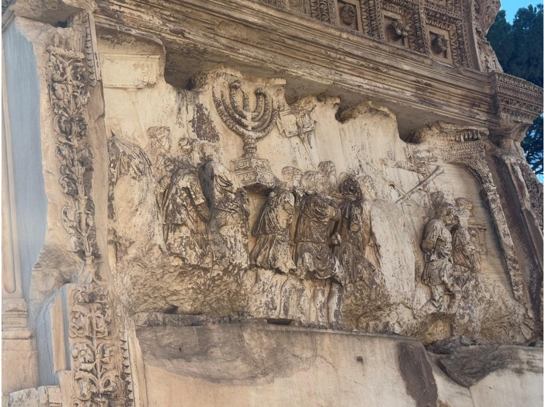
Resim 3.3: Titus Zafer Takı 3

Roma'da Titus Zafer Takı: Kudüs mabedinde bulunan ve MS 70'te Roma'ya taşınan Yahudilerin sembollerinden Menora (Yedi Kollu Şamdan)'nın taşınmasını betimleyen kabartmalar.