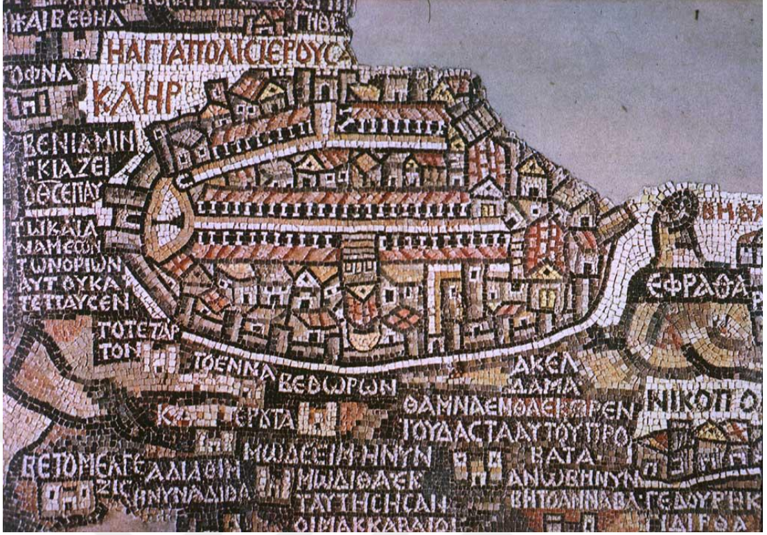
Resim 3.4: Madaba Mozaik Haritası, Ürdün. VI. yüzyıl