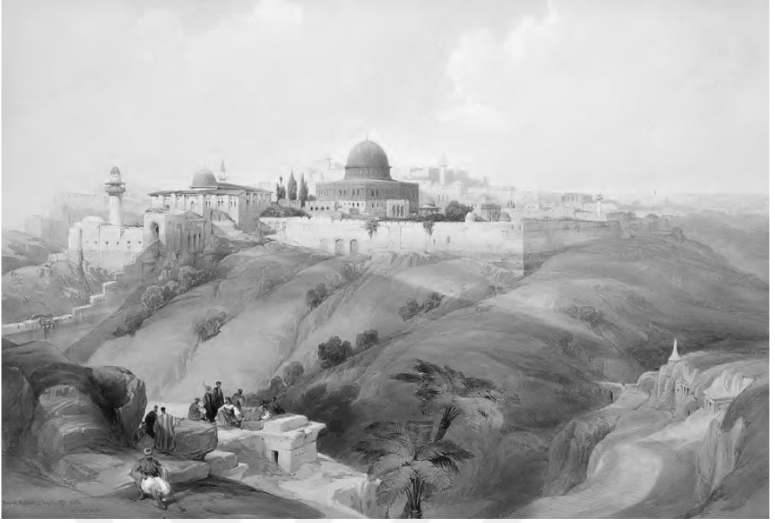
Resim 2.4: David Roberts, Zeytindağı'ndan Kudüs. XIX. yüzyıl.