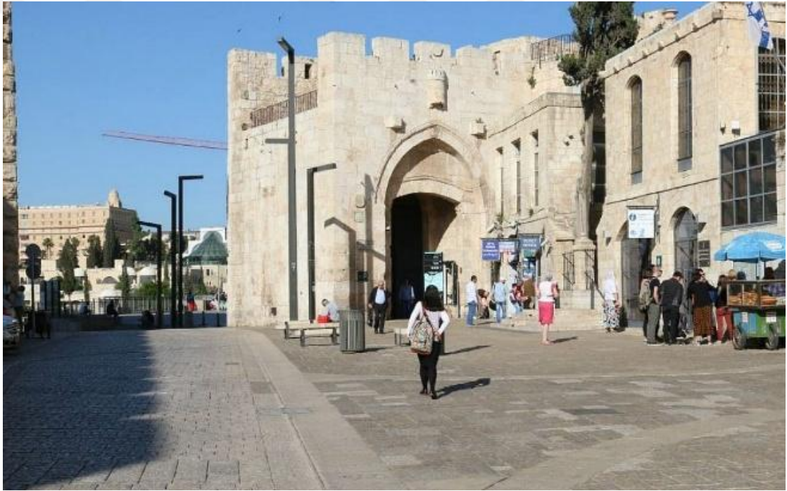
Resim 4.1: El Halil Kapısı

Iulianus ve Sasani yönetimleri döneminde olduğu gibi, Hristiyanlara yönelik herhangi bir taşkınlığa veya baskıya da izin verilmemiştir. Böylece İslami fetih siyaseti hem Yahudilere tanınan haklarla hem de Hristiyanlara sağlanan koruma ile dengeli ve adil bir yönetim anlayışı sergilemiştir. Bu uygulamaların Halife Hz. Ömer gibi, doğrudan Hz. Peygamber'in yakın çevresinden gelen bir lider tarafından hayata geçirilmiş olması, bunların kişisel bir hoşgörüden çok, İslam'ın temel ilkelerine dayandığını göstermektedir. Nitekim Hz. Peygamber tarafından Necran halkına yönelik uygulanan antlaşma örneğinde olduğu gibi farklı din mensuplarına tanınan haklar bu yaklaşımın tarihsel ve inanç temelli olduğunu ortaya koymaktadır. Asırlar süren İslam egemenliği boyunca devletlerin bu ilkeleri korumuş olmaları, uygulamaların sürekliliğini ve inanç temelli bir yönetim anlayışına dayandığını teyit etmektedir.