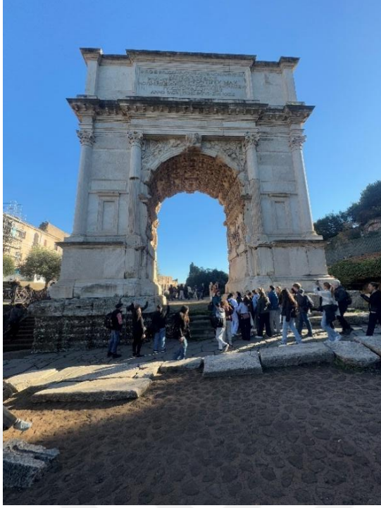
Resim 3.1: Titus Zafer Takı 1