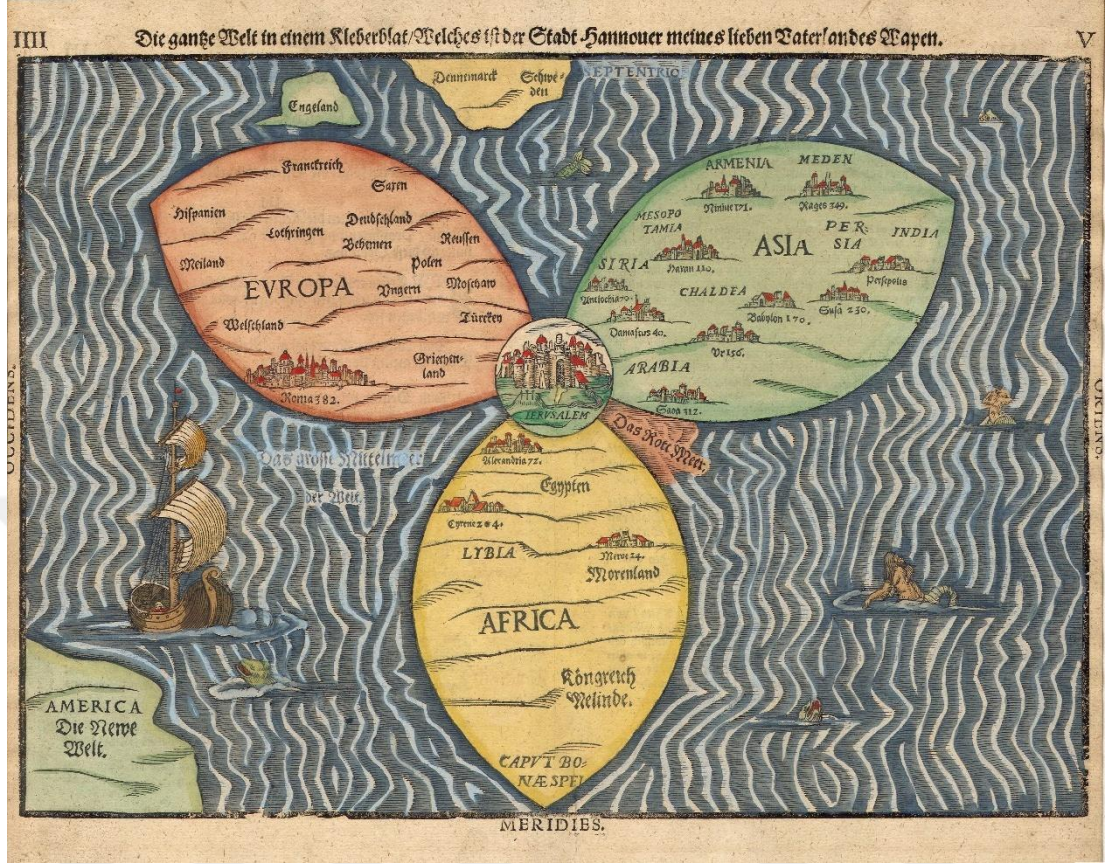
Resim 2.3: Heinrich Bünting'in dünya haritası, merkezde Kudüs.

ise yüzde ellinin üzerindedir. 170 Bu yönüyle Kudüs, dünya nüfusunun ve dünya ülkelerinin önemli bir kısmını etkileme ve harekete geçirme potansiyeline sahiptir.