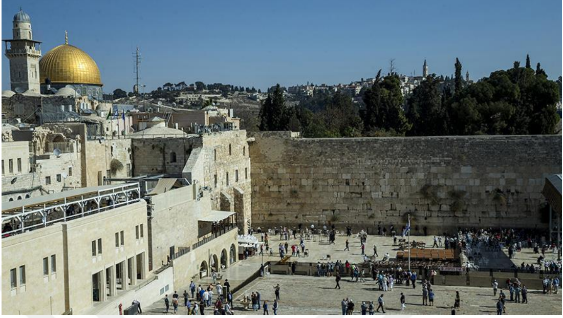
Mescid-i Aksa'nın Batı Duvarı*