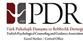
Türk PDR Derneği