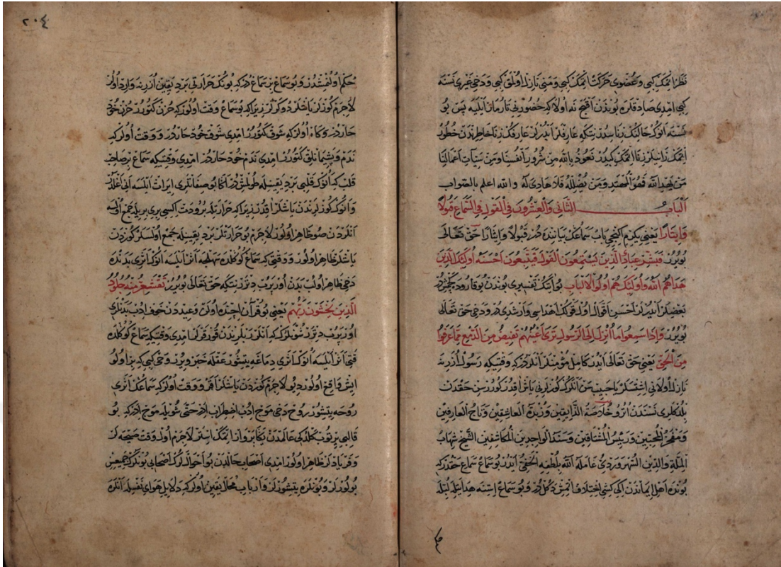
Ek 2.2: Terceme-i Avârif , 21. Bâb Hâtime.