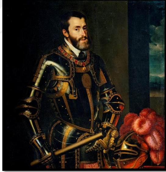
Soldan sağı sırasıyla Valois hanedanından I. François ve Habsburg hanedanından V. Karl.