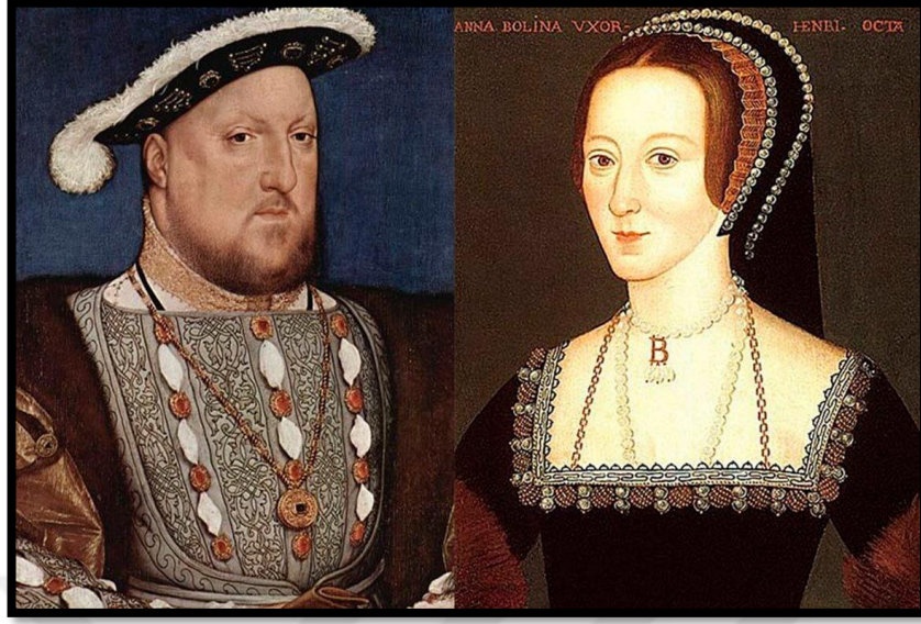
Solda VIII. Henry, sağda daha sonra tahta çıkan I. Elizabeth'in annesi Anne Boleyn.