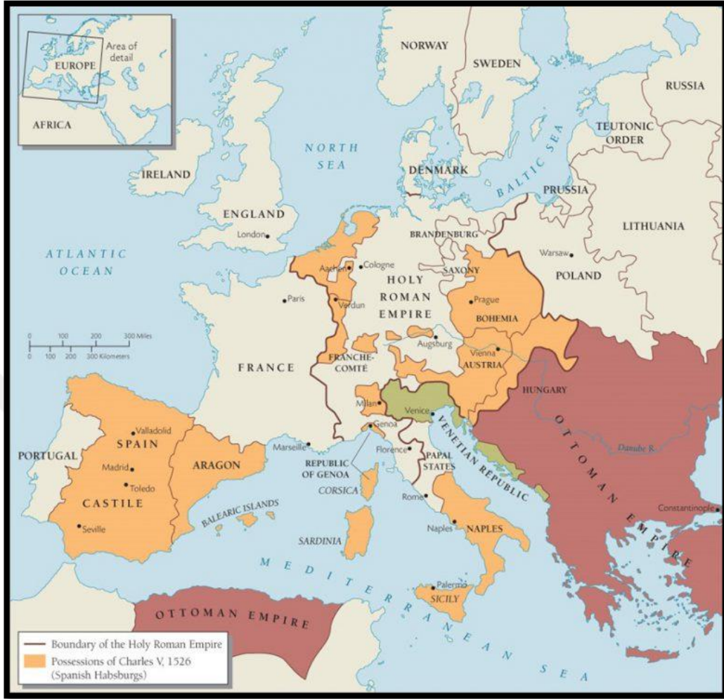
Ek 2. 16. Yüzyıl Osmanlı ve Habsburg Sınırlarını Gösteren Harita.