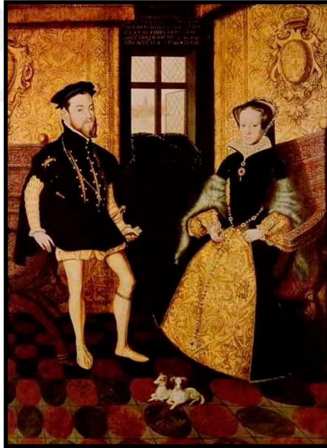
İspanyol Kralı II. Philip ve Müstakbel Eşi İngiltere Kraliçesi Mary Tudor.