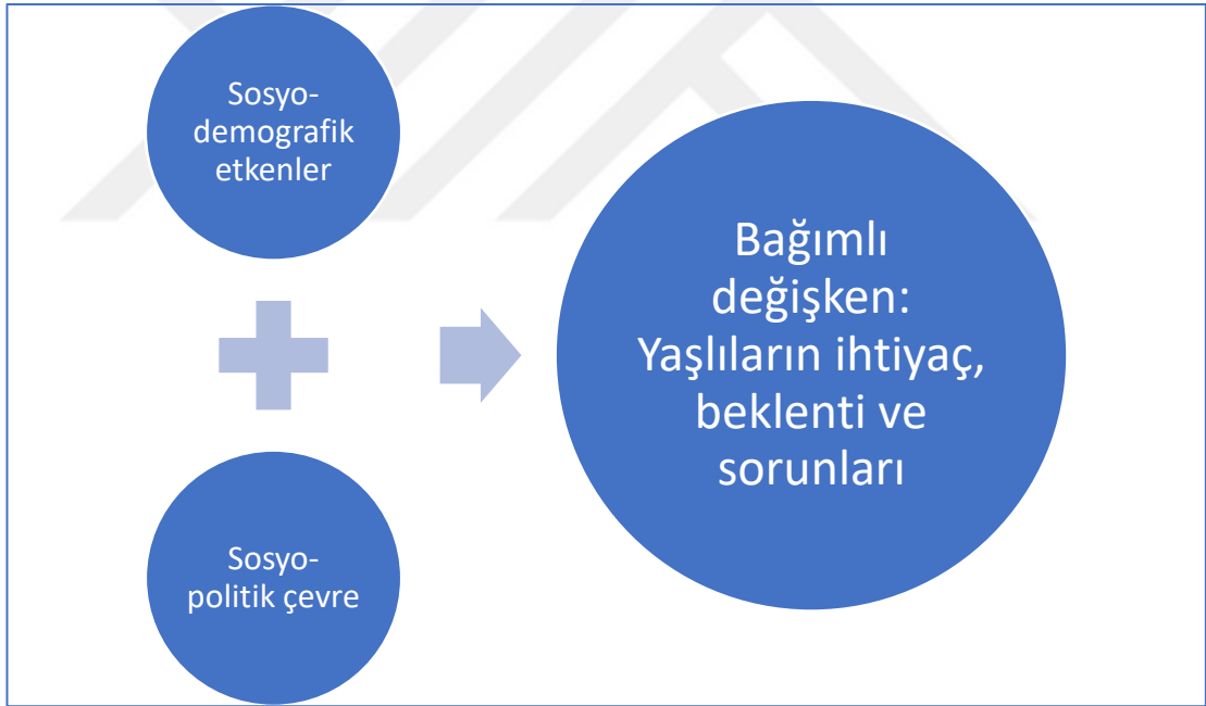
Şekil 4.1: Araştırmanın Bağımlı ve Bağımsız Değişkenleri

Araştırma modeli veya deseni bağımlı değişken ve bağımsız değişkenlerin gösterilmesine dayanan bir tasarımdır. Bu araştırmada bağımlı değişken “yaşlıların ihtiyaç, beklenti ve sorunları” olup bu değişkene etki eden bağımsız değişkenler iki grup olarak düşünülmüştür: “Sosyo-demografik etkenler ve sosyo-politik çevre”. Bağımlı değişken açıklanan, bağımsız değişkenler ise açıklayan etkenlerdir.