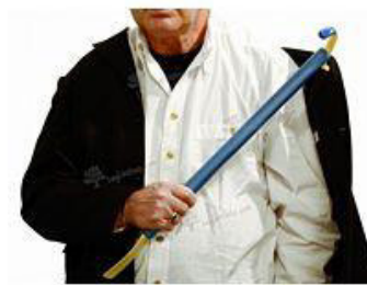
Şekil 7. Giyinme Çubuğu

Kolay giyinme çubuğu: Kolay giyinme çubuğu bireylerin fonksiyon kaybına karşı kıyafetlerini kendilerinin giyip çıkartmasına yardımcı olur. Gündelik yaşamda bireylerin bağımsızlığını korumasına yardımcı olur (Şekil 7).