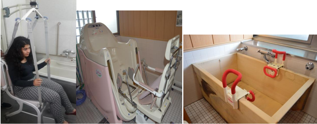
Şekil 3. Banyo aktivitesine yardımcı cihazlar (Fotograflar, Özlem Özgür'ün Mevlana programı kapsamındaki Japonya inceleme ziyaretinde çekilmiştir).

Kurumsal bakım alan ve yatağa bağımlı yaşlılara banyo yaptırılması, bakım veren için zahmetli; fazla iş gücü gerektiren ve birkaç kişi ile birlikte organize edilmesi gereken zor bir iş. Yardımcı teknolojik ürünler ve küvet tasarımları ile bakım verenlerin iş yükü hafifletilebilmektedir (Şekil 3).