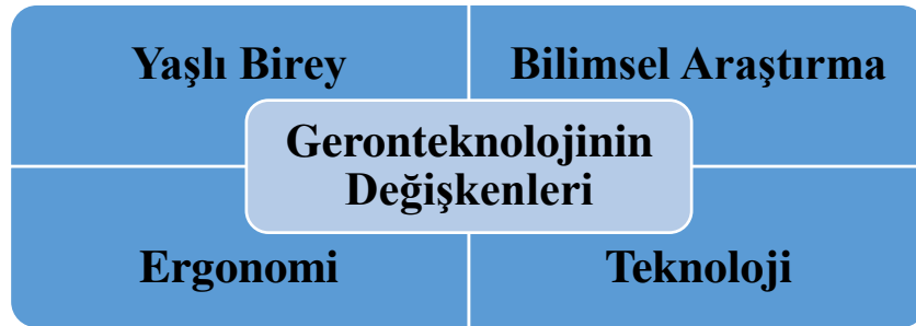
Şekil 1. Geronteknolojinin değişkenleri

Nüfusumuzun yaşlanması nedeniyle, günlük yaşamlarında yaşlılara yardımcı olabilecek, bağımsızlıklarını son döneme kadar devam ettirebilecekleri yeni teknolojilere ihtiyaç giderek artmaktadır. Yeni teknolojilere ihtiyaç duyulmasını iki ana nedene bağlayabiliriz. Bunlardan biri Batı ülkelerinin yakın gelecekte personel ve kalifiye sağlık personeli için ciddi bir sıkıntı yaşayacağını beklenmesi, ikincisi ise insanların, yaşamı ile ilgili sorunlar ortaya çıktığında; korunaklı evler veya bakım merkezlerinde kurumsal bakım almak yerine, kendi evlerinde yaşamayı daha çok tercih etmeleridir. 8