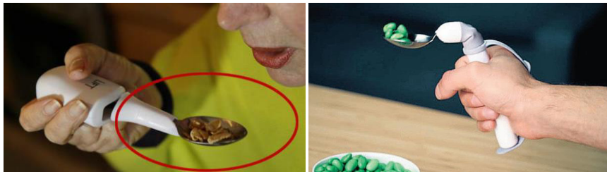
Şekil 5. El titremesine çözüm olarak tasarlanan kaşık

Yemek yemeye yardımcı temel cihazlar: Beslenme her canlıda olduğu gibi yaşlılar için de en önemli temel gereksinimdir. Yaşlılık döneminde görülen en önemli sorunlardan biri beslenme sorunlarıdır. Duyu kayıpları, kronik hastalıkların artması, sosyo-ekonomik durumların değişmesinden dolayı beslenme yetersizlikleri ortaya çıkabilir. Yaşlılarda görülen fonksiyon kaybına karşı beslenme sorunlarını azaltacak yardımcı ekipmanlar bulunmaktadır. Şekil 5'de görülen aletler Parkinson hastalarında görülen el titremesine çözüm olarak, daha rahat yemek yemelerine yardımcı olacak şekilde tasarlanmıştır.