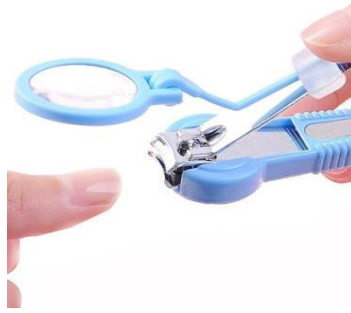
Şekil 6. Büyüteçli tırnak makası

Büyüteçli tırnak makası: Büyüteçli tırnak makası, yaşlıların görme fonksiyonlarındaki bozulmalara karşı geliştirilmiş bir alettir. Yaşlılar büyüteç yardımı ile tırnağı daha rahat görebilir ve tırnaklarını kendileri keserek bağımsızlık ve kendi kendine yetme duygularını koruyabilirler (Şekil 6).