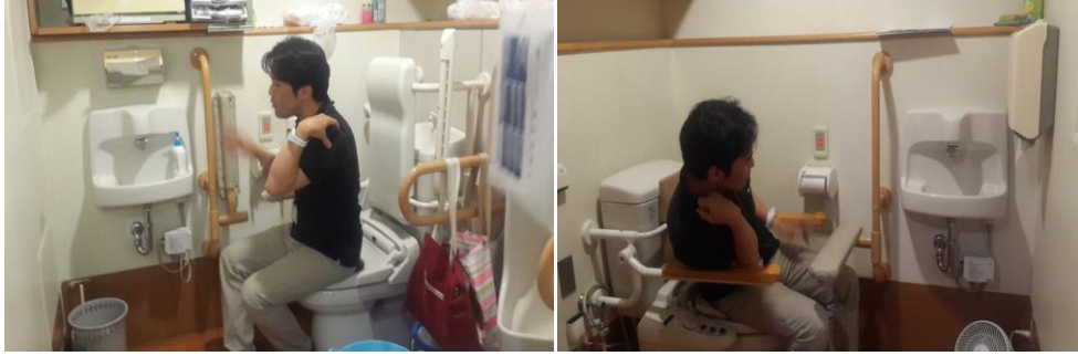
Şekil 4. Tuvalet aktivitesine yardımcı cihazlar (a) sol (b) sağdaki resim.

tasarlanmış tuvalet örnekleri gösterilmiştir. Tasarımlarda bireyin maksimum işlevselliğini gösterebilecekleri ve birine ihtiyaç olmadan ihtiyacının giderilmesine dikkat edilmiştir.