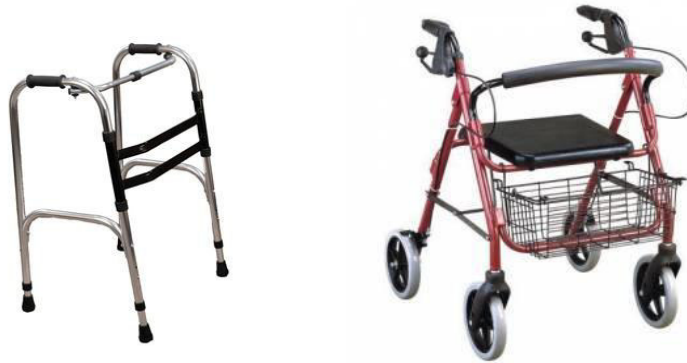
Şekil 2. Yürüteç çeşitleri

Yürüteçler ise bastonun yetersiz olduğu durumlarda kullanılabilir. Yürüteç, koltuk değneği ve bastona göre daha fazla destek sağlar. Yürüteçlere, desteksiz yürümede zorlanan bireyler için mobiliteyi korumak ve aktif yaşamı sürdürmek için ihtiyaç duyulur. Dengeyi arttırmak, alt ekstremitte üzerindeki yükü tam veya kısmi olarak almak amacıyla kullanılabilirler. İnaktif yaşam tarzı, yaralanmalara neden olan zayıf motor becerilerin oluşmasına ve yeteneklerinin giderek kaybolmasına sebep olur. Bu nedenle yaşlı bireylerin aktif kalması için yürüteç kullanılması çoğunlukla gereklidir. Akıllı yürüteçler fren sistemi ile daha istikrarlı ve kolay kullanım sağlamak; tek tuşla kontrol sistemi sayesinde kullanıcıların kazayla düşme oranlarını azaltmaktadır. Yürüteçler, kullanım amaçlarına göre, değişik tarz ve büyüklüklerde üretilmektedirler (Şekil 2). Yürüme güçlüğü çeken, yavaş yürüyen yaşlılar için sepetli ve tekerlekli yürüteçler tasarlanmaktadır. Yürüteç kullanımı yaşlıların günlük yaşam aktivitelerinde bağımsız olmak yanında, motor becerilerini kullanmaya teşvik etmesi açısından da önemlidir. 20