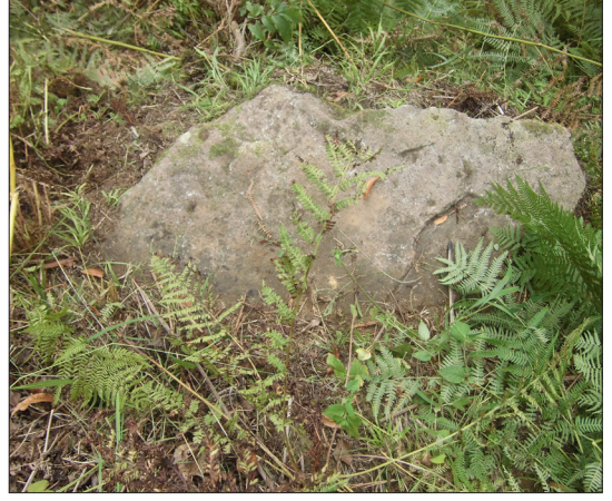
Dedemizin Nacar marka saati ve Anbet'te koropun avlusunda namaz kıldığı taş namazgâhı. Hâlâ yerinde duruyor, gidince biz de kılıyoruz.

Ahırın tamamı, hanbağının iki-üç tarafı, eviçerisinin toprak yahut üst-yol tarafı taş duvardır. Hayat kısmının iç duvarları tamamen çam tahtasından ahşaptır. Alt ve üst taşıyıcı keresteler, dikmeler ( bağacı, lata, istilar ) kestaneden, döşemeler ise gürgen ağacındandır. Hayatın ve odaların dış kısımları ise çoğunlukla çatma-yığıma denen ve içi tahta perde, dışı çatmalar arasının taş ve çamurla doldurulduğu duvarla çevrilidir veya nisbeten daha kalın tahta ile ve boğaz/geçme usulüyle yapılmış duvardır. (Aslında köydeki kullanımda duvar kelimesi sadece taştan yapılan kısımlar için kullanılır. Tahtadan olanların farklı adları vardır). Diğer iki eve gidildiği zaman da merkez ev burasıdır. Ailenin bir kısmı daima burada kalır. Kış mevsimi, iki baharın yarısı tamamen ve birlikte burada geçilir.