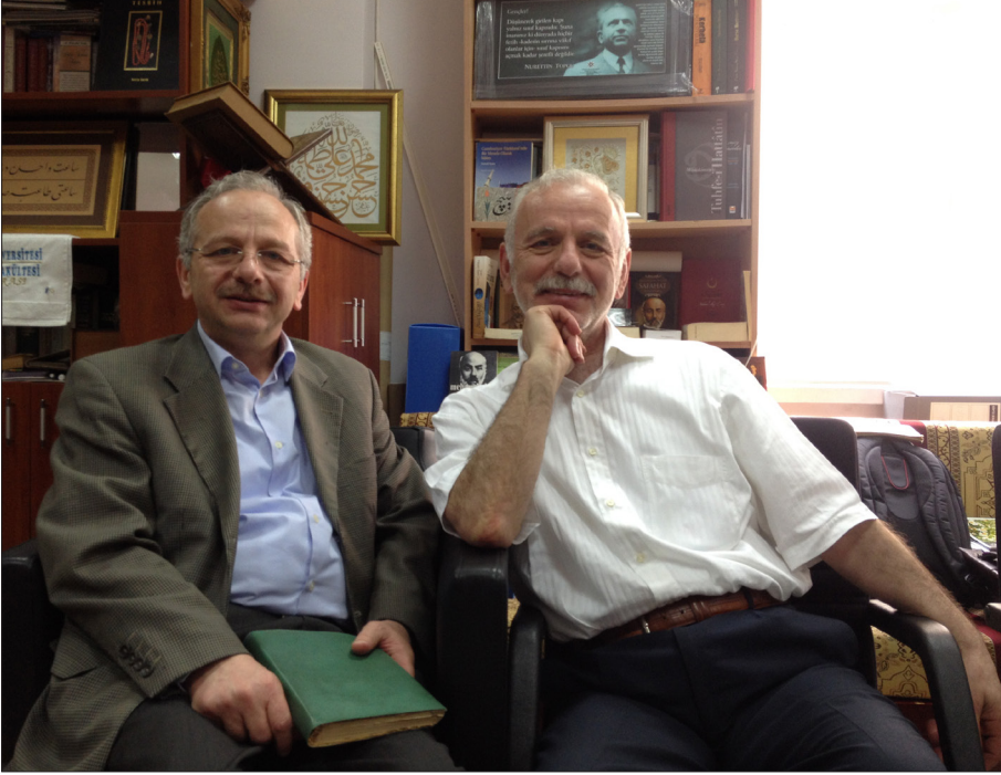
Hoca ağabey kardeş talebe ile. Bursa, 8 Mayıs 2015.

Mısır, taze fasulye ve güzelim patates Meyvenin her çeşidi toplansın yesin herkes Koroplar âh koroplar derin bir âh ve nefes O güzelim günleri ben de anmak isterim