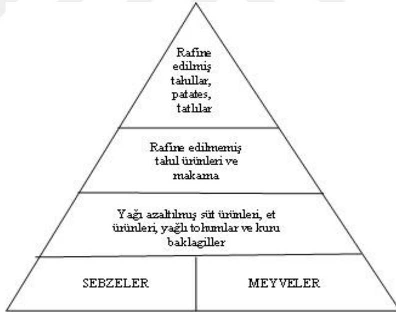
Şekil 1.1: Besinlerin Glisemik İndeks Piramidi

GI değeri düşük olan besinler kan şekeri daha yavaş yükseltir. Bu besinlere; kuru fasulye, nohut, mercimek ve yoğurt örnek olarak verilebilir. Çoğu meyve ve sebze düşük GI değerine sahiptir ancak kuru üzüm, kuru kayısı gibi kurutulmuş meyvelerin GI değeri yüksektir. Şekil 1.1'de besinlerin GI değerine göre gruplandırılması yer almaktadır (Jamurtas vd., 2019; Memiş ve Şanlıer, 2009; Akbulut vd., 2013).