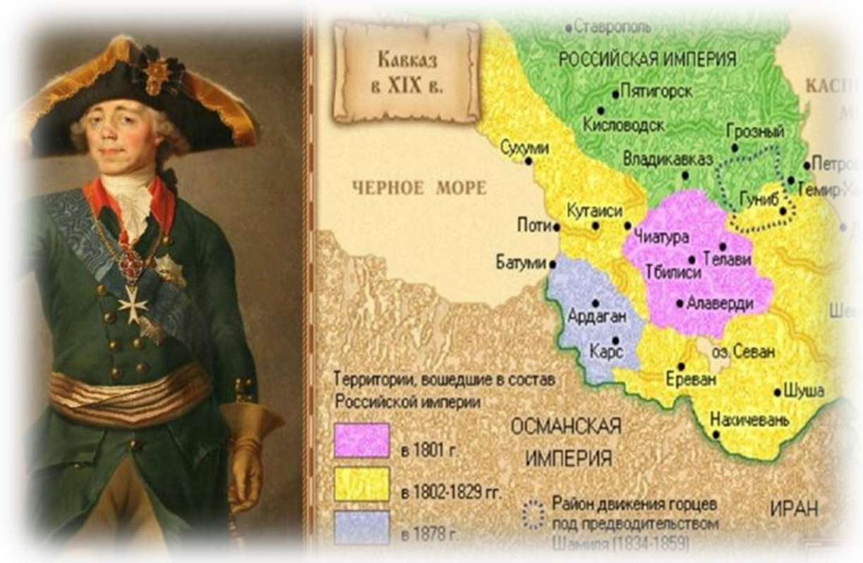
Doğu Gürcistan'ın Rusya'ya bağlanması