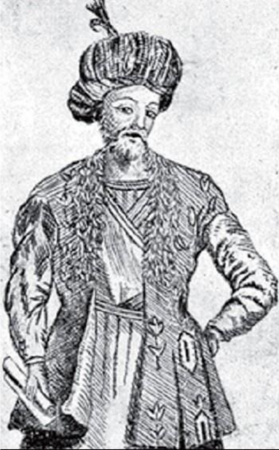
Gürcistan'ın ilk Müslüman Kralı Rüstem Han 1633-1658