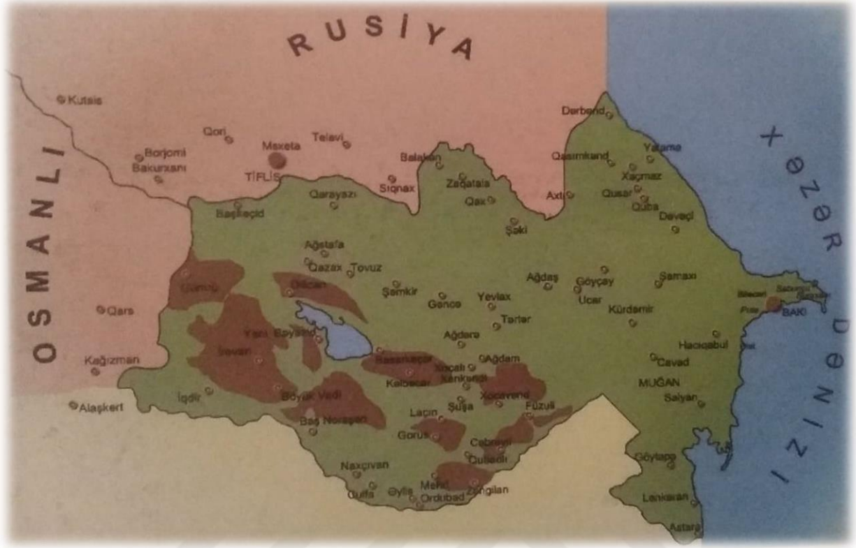
Ermenilerin Azerbaycan'a Kitleseel Göçü