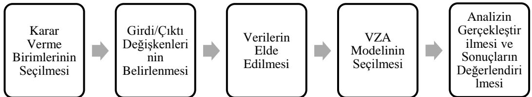
Şekil 3.1: Veri Zarflama Analizinin Süreçleri

VZA yönteminde sistematik bir düzende çalışmak oldukça önemli bir noktadır. Bu bağlamda VZA yönteminin analiz süreçlerinde şu aşamalar izlenmektedir;