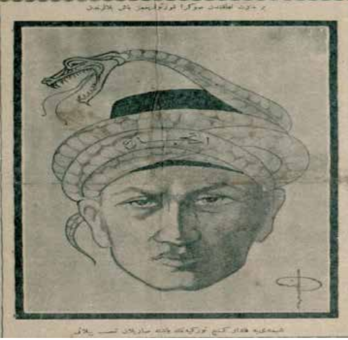
Resim 5: Bir Mart nutkundan sonra kurtulduğumuz baş belalarından.

Şimdiye kadar genç Türkiyenin başına sarılan taassup yılanı