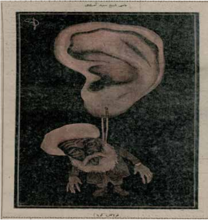
Resim 3: Asi Şeyh Said asıldı,

onların giyim tarzlarının değişmez enstrümanları olan sarık, cübbe, şalvar, sarık, sakal gibi motifler yaşanan toplumsal ve siyasi dönüşümle birlikte ciddi bir irtifa kaybı yaşamıştır. Türk- İslam geleneğinin başlangıcından bu yana belkide dini liderler ve din eksenli giyim tarzına karşı hiç oluşmamış bir toplumsal algı oluşmuş ve bu algıyla zikredilen grup ve giyim tarzına karşı olumsuz bir bakış açısı ekseninde şekillenen bir toplumsal değişim gerçekleşmiştir.