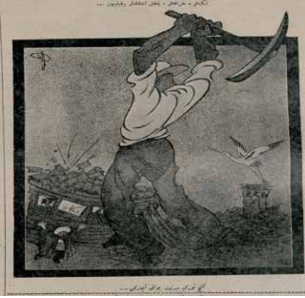
Resim 7: Tekkeler, hurafeler, batıl itikatlar yıkılıyor... Genç Türkiye medeniyet yolunu açarken...