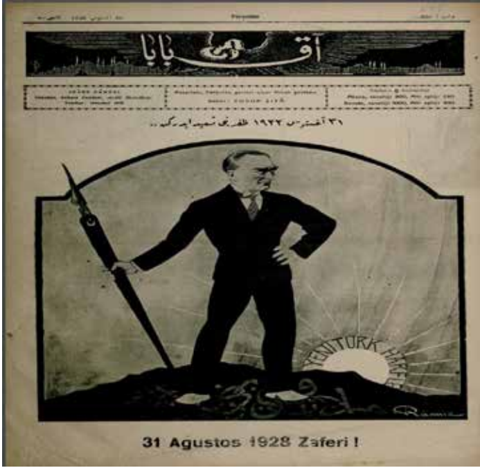
Resim 14: 31 Ağustos 1922 zaferini tesit ederken...

Bu karikatür (Resim 14) değişimin keskin bir resmini oluşturmaktadır. Modern Türkiye Cumhuriyeti'nin Kurucu Babası Halaskar Mustafa Kemal Atatürk üzerinde ay yıldız olan bir kalem elinde tutmaktadır. Ayaklarının altında ise karanlıklar içerisinde Arap harfleri bulunmaktadır. Arka fonda yeni Türk harfleri bir güneş gibi parlamaktadır.