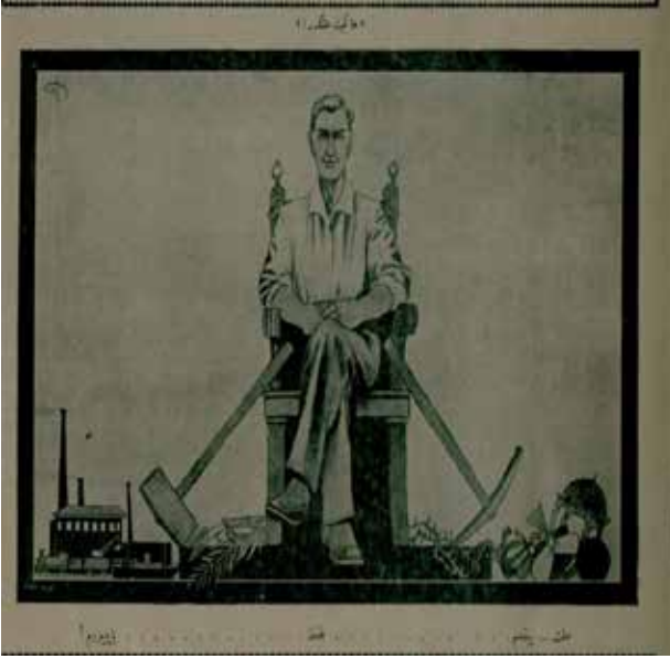
Resim 12: “Hakimiyet milletindir!”

ekonomi sonucunda cumhuriyet köylüsünün orağı sürekli çalışmaktadır. Saltanat köylüsünün bulunduğu yerin belirgin mekanı camii iken yaşanan toplumsal ve siyasal değişim sebebiyle cumhuriyet köylüsünün bulunduğu yerin belirgin mekanı fabrikadır.