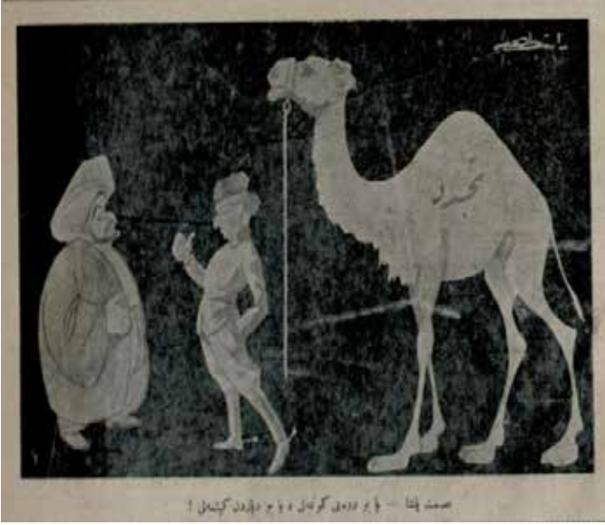
Resim 2: İsmet Paşa; Ya bu deveyi gütmeli, ya bu diyardan gitmeli !

Kaynak: Akbaba, 9 Mart 1341, Sayı:236, s.2.