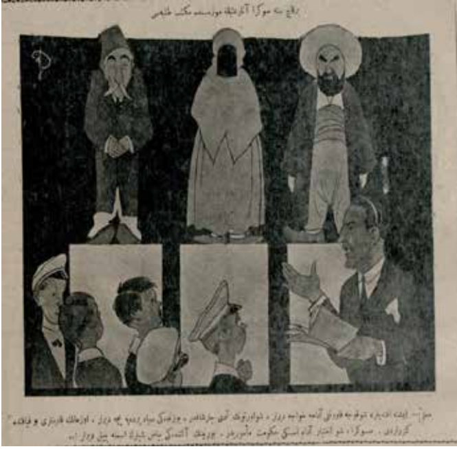
Resim 8: Birkaç sene sonra asarîatika müzesinde mektep talebesi.

Muallim: İşte efendiler, şu koca kavuklu adama hoca derler. Şu örtünün adı çarşaftır. Yüzündeki siyah perdeye peçe derler. O zamanın kadınları bu kıyafette gezerlerdi. Sonra şu ihtiyar adam eski hükümet memurudur. Burnunun altındaki beyaz şeylerin ismine bıyık derler!..