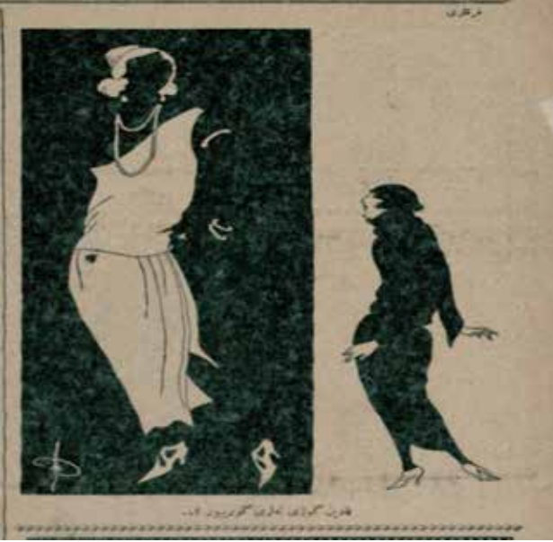
Resim15: Kadın gözü neleri görüyor ?

Karikatürde (Resim 15) bir tarafta kapalı, diğer tarafta ise açık giyim tarzını benimsemiş iki kadın yer almaktadır. Kapalı giyinen kadın, açık giyim tarzını benimsemiş kadına hayranlıkla bakmakta ve karikatürün altında “Kadın gözü neleri görüyor?” yazısı yazılmıştır. Bu karikatür toplumsal yaşamda kadının kılık kıyafetinde yaşanan değişimi karşılaştırmalı bir şekilde resmetmiştir. Bir yanda eskinin giyim tarzı diğer yanda ise toplumun yaşadığı değişim sonucunda oluşan yeni giyim tarzı karikatürize edilmiştir.