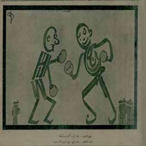
Resim 13: Latin harfleri: Dikkat et, tekme yiyeceksin Arap harfleri: Bunu yapmak, beni okumak kadar zordur!..

Karikatürde (Resim 13) eski ve yeninin aynı karede resmedilmesiyle toplumda var olan değişimin gösterilmesi amaç edinilmiştir. Bir yandan eskinin harfleri olan Arap harfleri diğer taraftan yeninin sembolü olan Latin harfleri. Harf sistemi konusunda yaşanan değişim toplumların tarihinde pek sık rastlanılan bir değişim değildir; zira bu değişimin tesir sahası diğer tüm değişimlerden daha geniştir. Türk toplumsal hayatı bu değişimi yaşayan nadide yapılarıdır. Karikatür’de Arap harflerinden müteşekkil olan eski Türkçenin okunma zorluğuna vurgu yapılmıştır. Bu durum, büyük bir ihtimalle harf inkılabına zemin hazırlayan temel sebeplerden biridir.