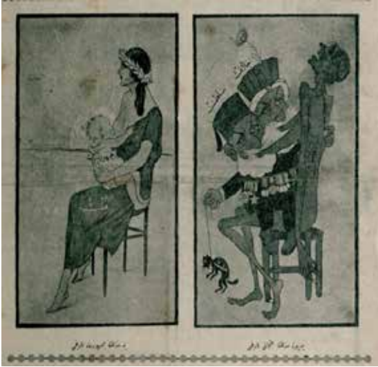
Resim 10: Bir senelik Cumhuriyet tarihi Yediyüz senelik Osmanlı tarihi

Karikatürde (Resim 10), Osmanlı tarihi ve Cumhuriyet tarihi mukayesesi üzerinden toplumsal değişim incelenmiştir. Sağ taraftaki karikatürde başının üzerinde hilafet ve saltanat yazan iki sakallı kişi üzerinde anavatan yazan bir kadını eme eme sıksa ve çelimsiz bir hale sokmuştur. Ayrıca kafasının üzerinde saltanat yazan kişinin elinde boynundan sıkı sıkı bağlanmış bir kedi bulunmaktadır ve kedinin üzerinde millet yazmaktadır. Sol taraftaki karikatürde güzel ve dinç bir hanımefendi vardır bu hanımefendinin üzerinde millet yazmaktadır. Hanımefendinin emzirdiği şirin ve tatlı çocuğun üzerinde cumhuriyet yazmaktadır ve arka fonda güneş her tarafı aydınlatmaktadır. Karikatürde hilafet ve saltanat müesseselerinin sömürdüğü vatan ve bu müesseselerin kuklası olan bir millettten, milletin sinisinden kopan ve milletinden başka bir güvencesi olmayan aydınlık cumhuriyete doğru yaşanan toplumsal değişim çarpıcı bir vaziyette resmedilmiştir.