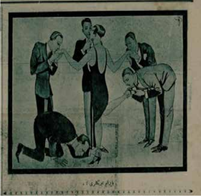
Resim 16: Bayram tebrikleri

toplumsal ve siyasal değişimle birlikte bir erkeğin tek eşi olma hakkını kazanmış buna ek olarak o bahtiyar eş olmak isteyen beş kişiyi adeta etrafında pervaneye çevirmiştir. Bu karikatür toplumsal hayatta kadının yerinin daha farklı bir konuma geldiğini, kadının değişen fonksiyon ve önemini bu şekilde resmetmiştir. Ayrıca karikatür ataerkil eksenli Türk toplumun yapısında yaşanan değişim sonucunda oluşan farklılaşmayı da ortaya koymaktadır.