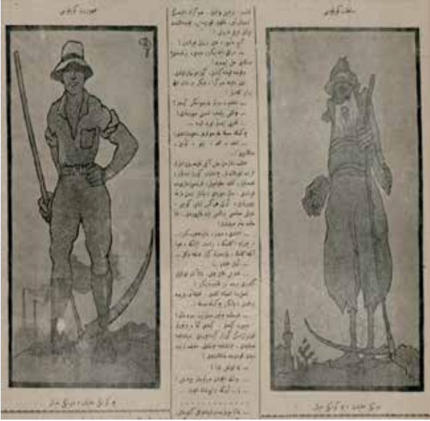
Resim 11: Cumhuriyet köylüsü Saltanat köylüsü Bugünkü hakikat, dünkü hayal Dünkü hakikat, bugünkü hayal

Karikatürde (Resim 11) Saltanat köylüsü ve Cumhuriyet köylüsü üzerinden yaşanan toplumsal değişim resmedilmiştir. Sağ tarafta sakallı, sarıklı ve şalvarlı yaşlı bir amcannın elinde örümcek ağları bağlamış bir orak bulunmaktadır. Resmin arka fonunda ise bir camii bulunmaktadır. Sol tarafta ise kafasında fötr şapka olan güçlü ve genç bir delikanlının elinde daha büyük ve işlevsel bir orak vardır. Arka fonda ise bir fabrika bulunmaktadır.