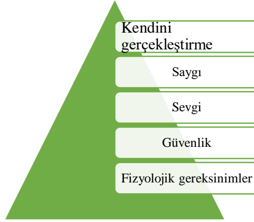
Şekil 2.2: Maslow'un İhtiyaçlar Hiyerarşisi Kuramı

yönelemez. İnsanın bir üst basamaktaki ihtiyacının alt basamaktaki ihtiyacı tatmin edilmişse ortaya çıkacağı ifade edilmiştir.