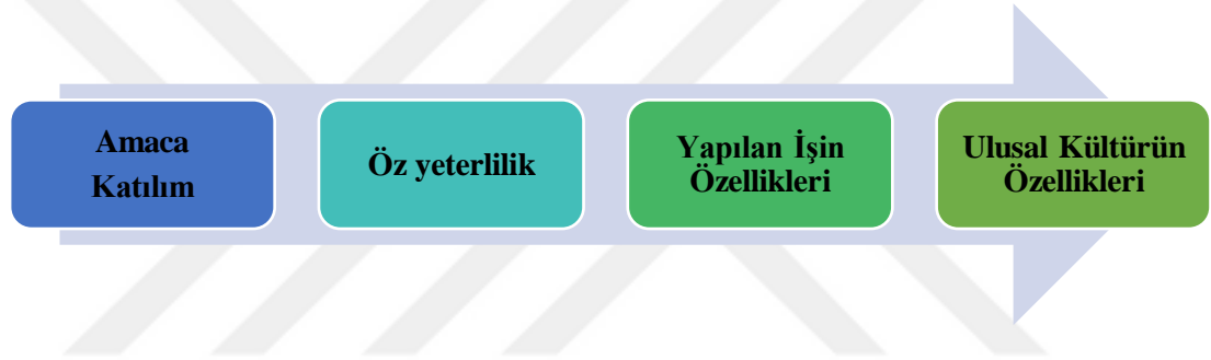
Şekil 2.5: Amaç-Performans İlişkisi

Locke, amaç-performans ilişkisini dört temele dayandığını ifade etmektedir (Tınaz, 2013). Bunlar aşağıdaki ifade edilmiştir: