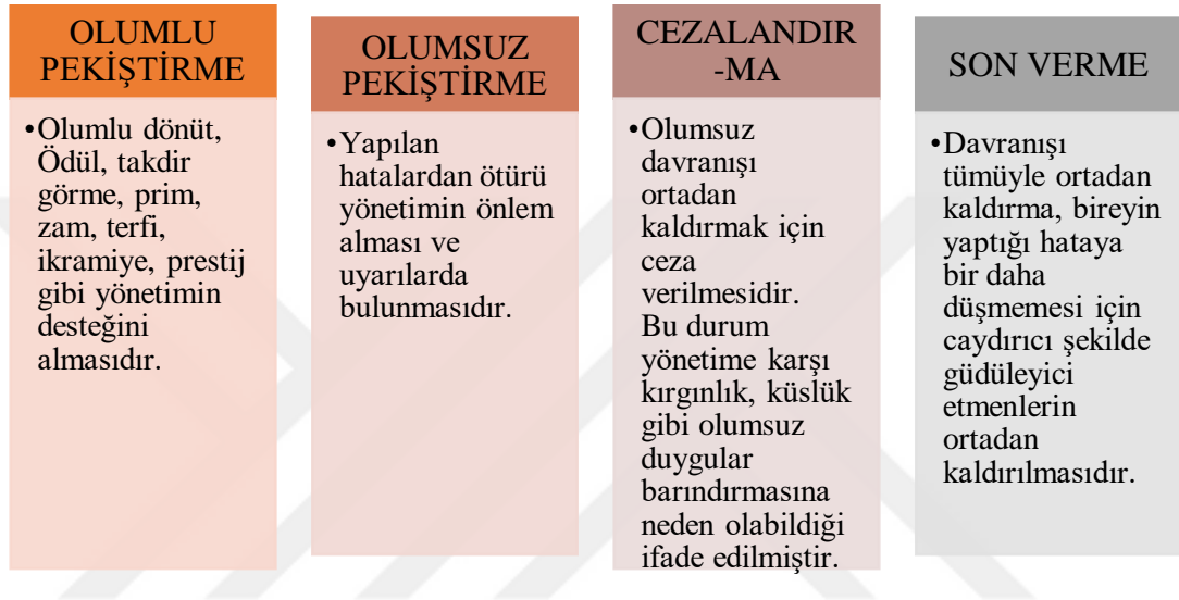
Şekil 2.4: Şartlandırma ve Pekiştirme Kuramı

Olumlu davranışın devamı için pekiştirme, olumsuz davranışın tekrarlamaması için dört yöntem bulunmaktadır. Bunlar aşağıdaki gibi açıklanmaktadır.