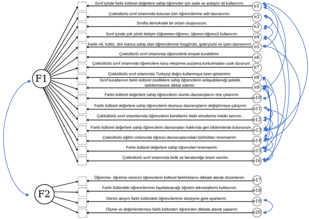
Tablo 4.11: DFA Ölçüm Modeline İlişkin Sonuçlar