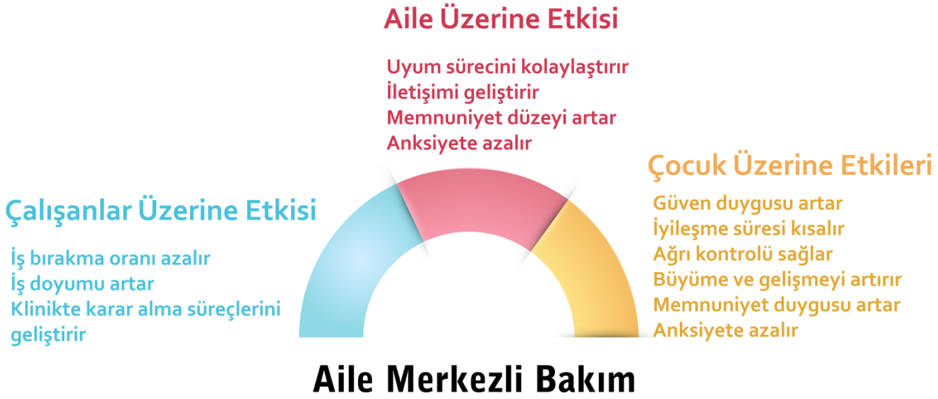
Şekil 1. Aile Merkezli Bakım Anlayışının Çocuk, Ebeveyn ve Çalışanlar Üzerine Etkisi

Aile merkezli bakımın çocuk, ebeveyn ve çalışan üzerine etkileri Şekil 1'de verilmiştir