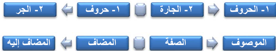
Şekil 1.3.1.1: İzâfet Terkîbi ile Sıfat Terkîbi Bileşenlerinin Hareket Yönü

Bu meseleyi biraz daha açmak gerekirse, öncelikle izâfet ve sıfat kavramlarını inceleyelim, sonrada izâfet ve sıfat terkîpleri arasındaki farklılıklara bakalım. İzâfet ; bir ismin diğer isme nisbet edilmesi ve aralarında sınırlandırıcı bir bağ kurulmasıdır. Sıfat ise; bağlı olduğu ismi bir niteliğiyle belirten tamamlayıcı unsurdur. 2 İzâfet terkîbi [حروف الجر] örneğinde olduğu gibi [مضاف] ve [مضاف إليه]'ten oluşur. Burada birinci isim ikinci isme katılmıştır. Sıfat terkîbi ise [الحروف الجارة] örneğinde olduğu gibi [الموصوف] ve [الصفة]'den oluşur. Burada da ikinci isim birinci isme katılmıştır. Aşağıdaki şekilde bu iki terkîbe ait bileşenlerin hareket yönü resmedilmiştir. (Bkz. Şekil 1.3.1.1)